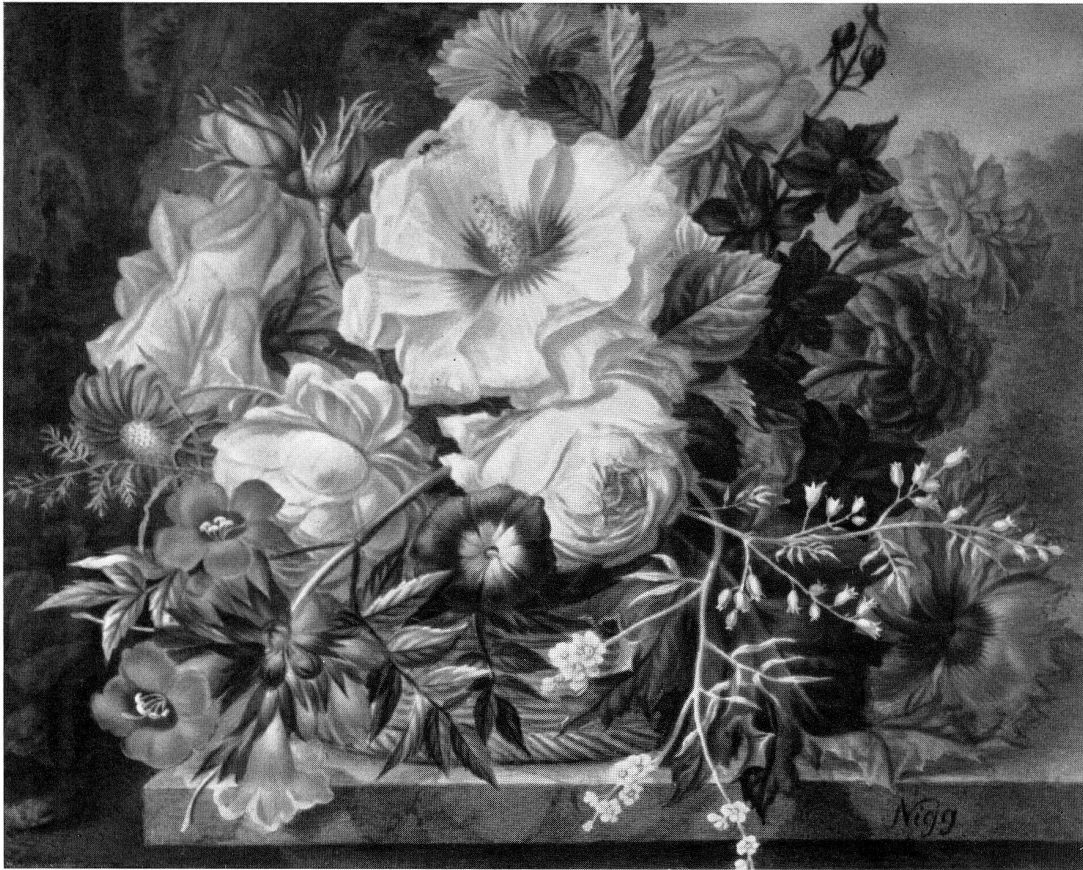
Abb. 5 Blumenmalerei auf Porzellan, signiert Nigg, Bes. Ernest Fisher, London