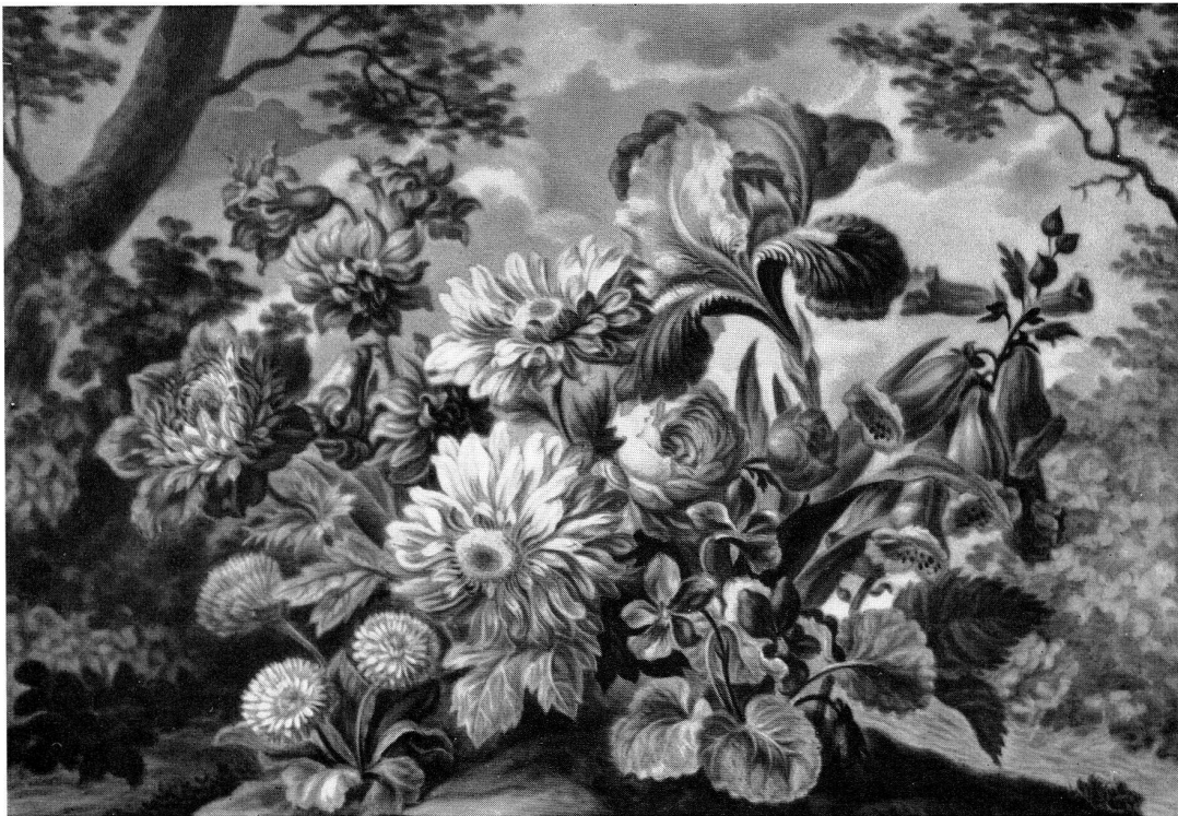
Abb. 6 Blumenmalerei auf Wiener Porzellan, erste Hälfte 19. Jahrhundert, ehem. Museum für angewandte Kunst, Wien