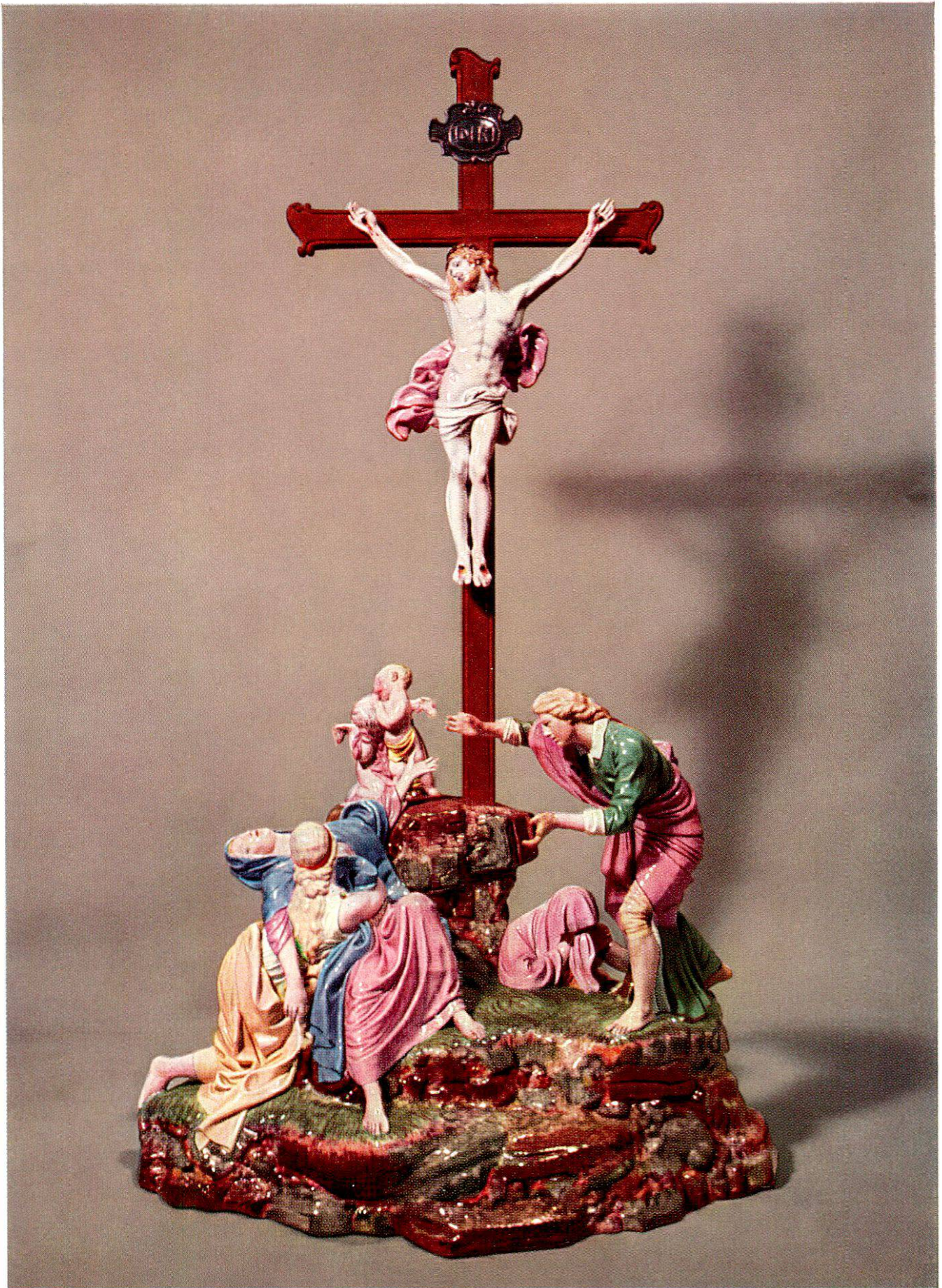
Johann Peter Melchior als Modellmeister in Höchst