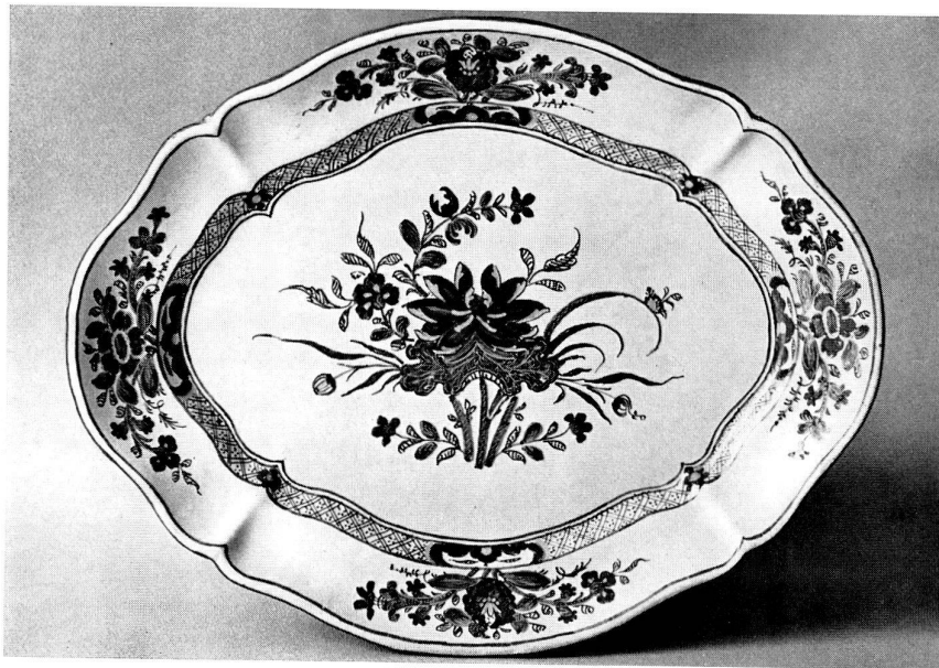
Fig. 6 Vassoio con fiore di loto policromo, Faenza, terzo quarto del sec. XVIII.