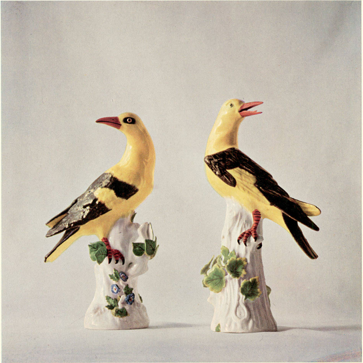
Zwei Pirole, Modelle von J. J. Kaendler, März 1734. Höhe 26,5 cm.