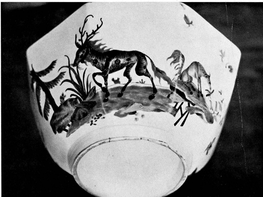
Abb. 25. Eine zweite Ansicht der Kumme Abb. 24.