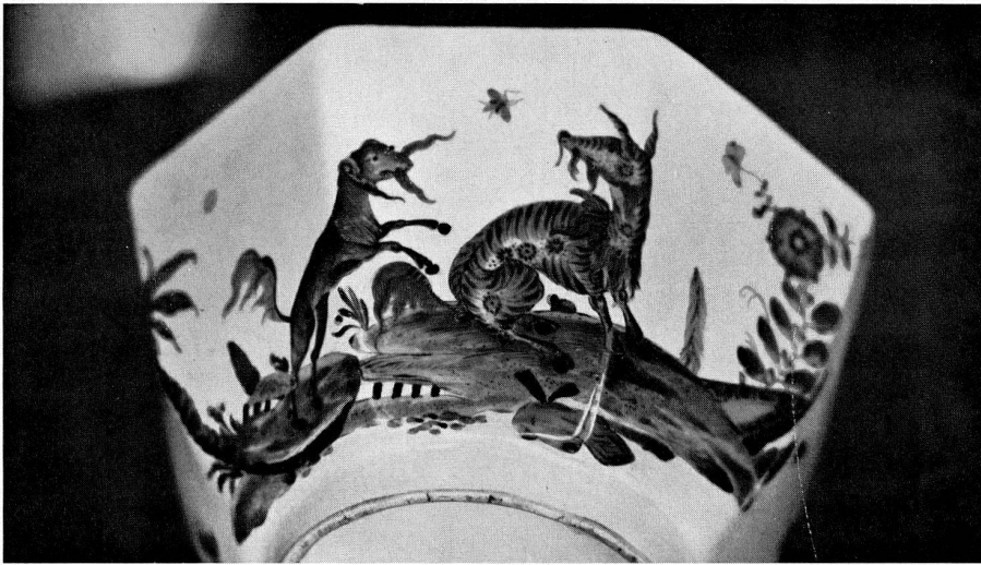
Abb. 24. Kumme, bunt bemalt mit Fabeltieren in Landschaft. Marke: Schwerter, Meissen um 1739.