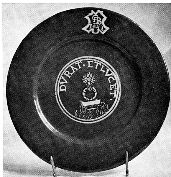
Abb. 3. Dunkelblau glasierter Fayenceteller mit Symbol und Devise, welche sich auf die Exilzeit der Freiherren v. Silberstein während des Dreissigjährigen Krieges beziehen. Die Bemalung nach Octavio de Strada. Wiedertäuferezeugnis, dat. 1651.