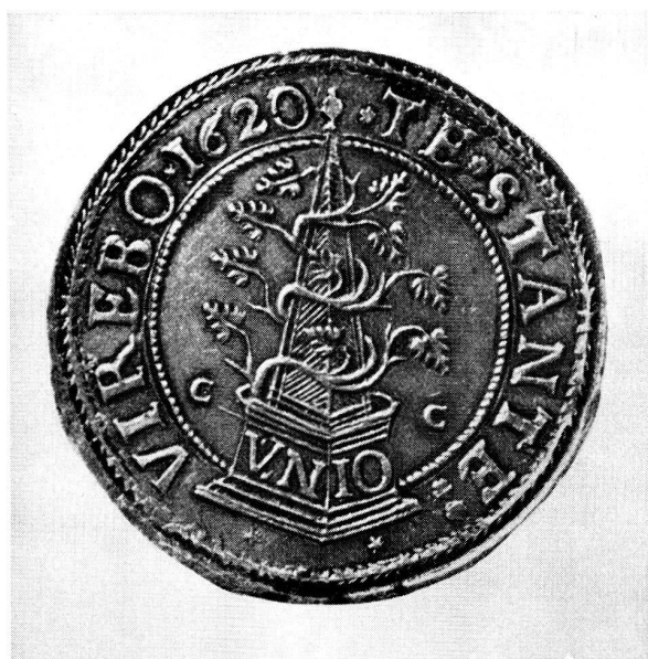
Abb. 2. Taler der aufständischen protestantischen mährischen Stände aus dem Jahre 1620 nach einer graphischen symbolischen Darstellung des Octavio de Strada, Hofantiquar Kaiser Rudolfs II.