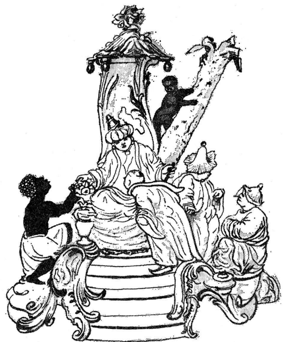
rend er dort auf einem vasenähnlichen Aufbau thront. Hier kommt der Höfling von links auf den Thron zu, dort steigt er die Treppe hinauf.