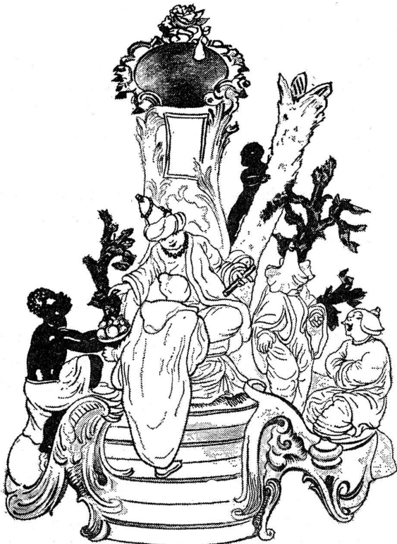
Türkischer Kaiser. Auch bei den beiden hier abgebildeten Gruppen finden wir die wiederkehrenden Änderungen der Höchster Kompilatoren. Hier sitzt der Sultan unter einem Baldachin, wäh-

Am Schluss seiner Ausführungen erfahren wir von Oppenheim überraschend über den Chinesenmeister folgendes (Seite 105): «Vielleicht besteht eine Verbindung zwischen