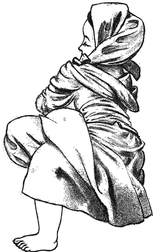
Zeichnerisch dargestellte Faltenkompositionen von Melchior zum Vergleich mit Abb. 18 (Russinger).