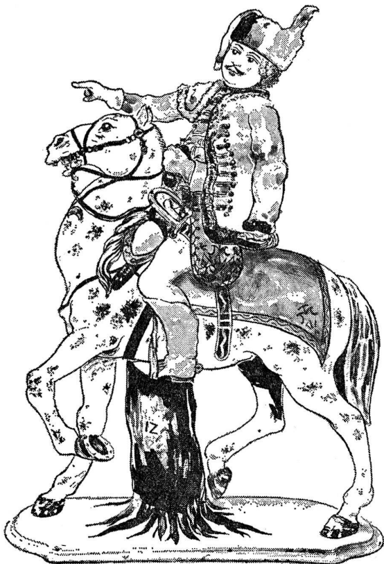
Husar zu Pferde, Fayence.

die Manufaktur Meissen und kamen zunächst nach Höchst. In den Höchster Akten werden sie genannt, Die zwei säch-