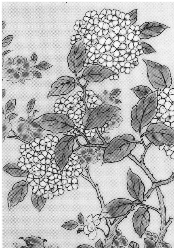
Rosa Familie. Detail aus einer durchbrochenen Schale (1723 bis 1735).

Bourg-en-Bresse: Das Musée de Brou zeigt diesen Sommer die Ausstellung «La fayence de Meillonas, 1760–1845». Die Ausstellung gründet auf den Untersuchungen von Jean Rosen, der auch Verfasser der bedeutenden Begleitpublikation ist. In ihr wird erstmals der Versuch unternommen, einen Überblick über die Produktion dieser wichtigen Fayencemanufaktur zu geben (bis 5. September). – Für die Keramikfreunde der Schweiz ist Meillonas besonders interessant durch seine enge Verbindung zur Schweiz in der Person von Protais Pidoux, dessen Werk das 1992 erschienene Buch von Anne Marie Moussu-Epple, «Protais Pidoux 1725–1790, un maître peintre en fayence au 18 e siècle», gewidmet ist.