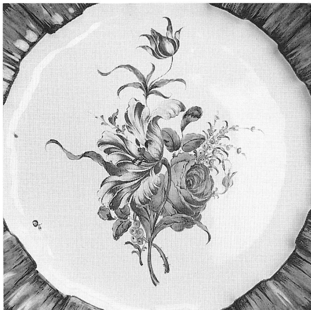
Fayence de Meillonas 1763/66.