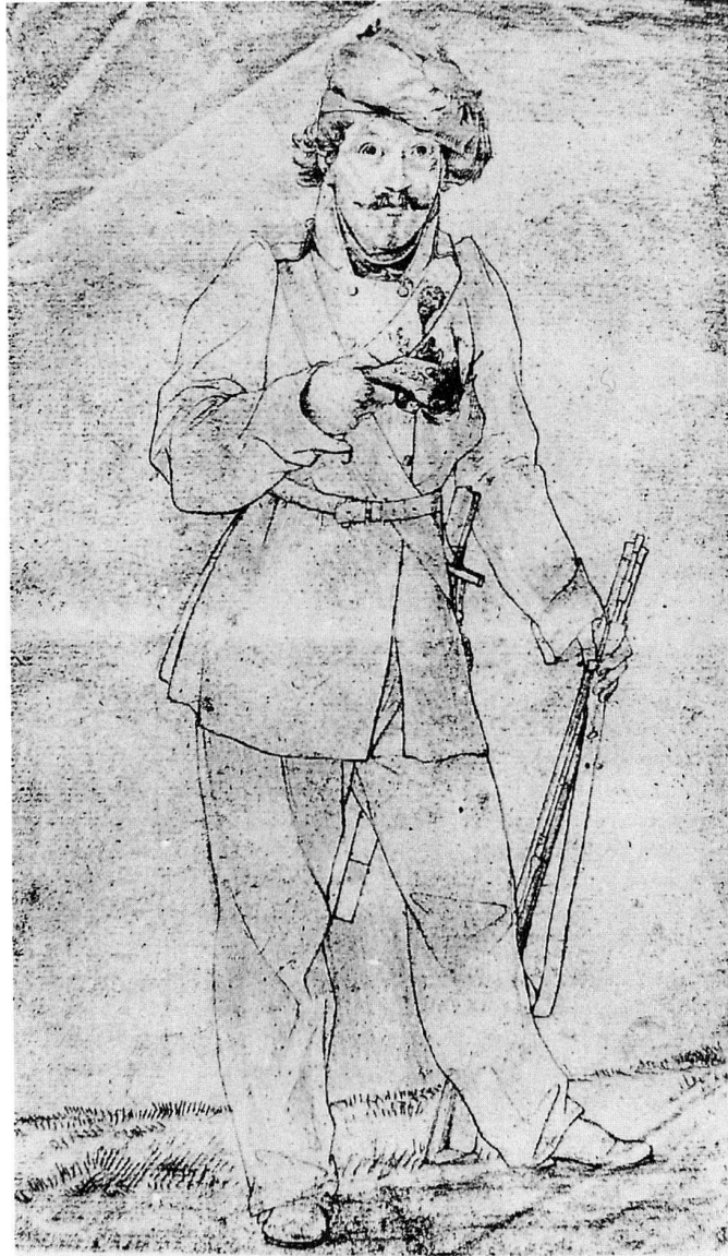
Abb. 4 Selbstbildnis als Lützower Jäger, 1813. Bleistift, 275×175 mm. Privatbesitz. Literatur: Gebrig 1932, S. 29.