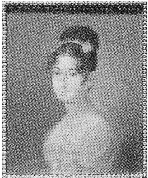
Abb. 5 «Anna Sapieha-Szartoryska», um 1817. Miniaturbildnis, 95×83 mm. Öl/Karton. Warschau, Nationalmuseum.

Für Georg Friedrich Kersting war die Warschauer Zeit eine widersprüchliche. Einerseits gewährte ihm der Aufenthalt im Palais der Fürstin Sapieha als Zeichenlehrer ihrer Kinder materielle Sicherheit. Die einst in Paris als gefeierte Schönheit glänzende kluge Fürstin empfing national gesinnte polnische Adlige in ihrem Hause. Kersting malte für sie Porträts und historische Bilder. Andererseits vermißte er seine Freunde aus Dresden, besonders die Braut Agnes. Je länger der Aufenthalt dauerte, um so stärker wurde der Wunsch zurückzukehren, trotz der wohlwollenden Aufnahme und Anerkennung in Warschau. 35 Seine Bilder wurden von dem kunstverständigen Grafen v. Zamoyski gelobt. Der Lega-