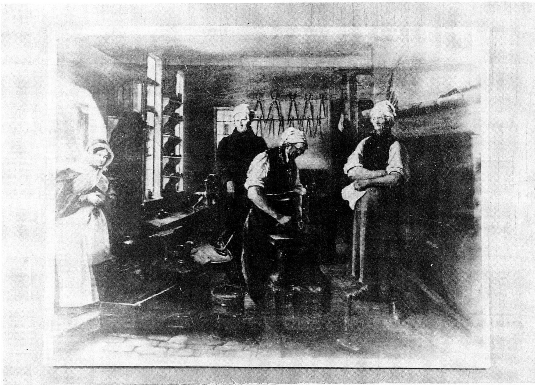
Abb. 2 «Die Schmiedewerkstatt», 1809. Öl/L., Foto des verschollenen Gemäldes Güstrow, Museum der Stadt Güstrow.