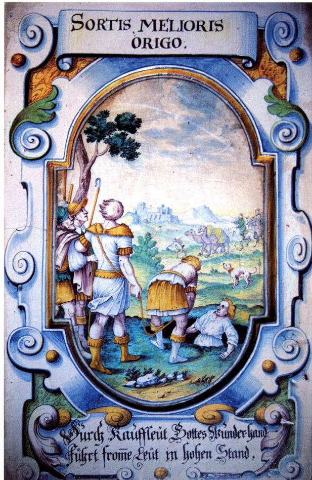
Abb. 11: Joseph wird aus der Grube gezogen (AT 43), um 1700 Winterthurer Ofen im Grundhof Luzern Bellwald, Winterthur 146 (hier nicht im Ofenkatalog)

Beispiel eines Bibelbildes als Emblem mit Überschrift, Bild und Text: