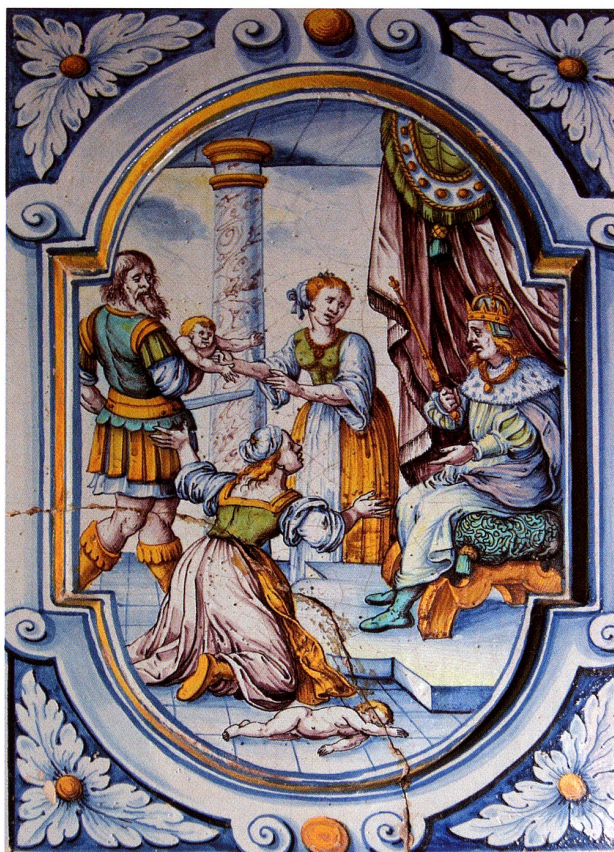
Abb. 12: Salomos Urteil (AT 137), Winterthurer Kachel, 1690 am Rathausofen Malans. (Bellwald, Winterthur 82, Früh, Rathäuser , S. 54 ff., hier nicht im Ofen- und im Bilderkatalog)

Ein Ofen wurde 1690 für das Rathaus Malans 12 geschaffen. Zwischen reliefierten Lisenen stehen Füllkacheln mit Emblemen zur guten Regentschaft. Sie sollten die in der Ratsstube versammelten Ratsherren an ihre Pflichten ermahnen, was die beigegebenen Sprüche deutlich ausdrücken. Da findet sich z.B. das Schiff des Gemeinwohls, dessen gute Lenkung nur mit Hilfe Gottes möglich ist, weiter Hinweise auf Belohnung und Strafe durch eine gute Obrigkeit, aber auch auf die Gefahren des hohen Standes, dessen Glieder umso tiefer fallen können, je höher sie standen. Innerhalb dieser Regenten-Embleme stehen zwei biblische Bilder. Das eine zeigt David, der zum König gesalbt wird, mit dem auslegenden Spruch, dass Gott die Gesalbten auch schütze (vgl. Kapitel Vorlagen , Abb. 26). Das andere zeigt Salomos Urteil, den Inbegriff weiser Entscheidung. (Abb. 12)