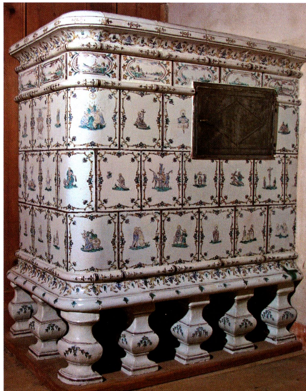
Abb. 44 Freiburger Ofen, 1768. Bulle, Museum (Ofen 78)

Auch hier bildeten die Zwillingsofen des Freiburger Rathauses (Öfen 79, 80) einen Sonderfall. Je zwei Bibelkacheln stehen paarweise nebeneinander, dazwischen eine mit Trophäen bemalte Füllkachel. Alle Kacheln sind mit Louis XVI-Umrahmungen versehen. Am untern äussern Ende der Bibelkacheln umfasst der Rahmen ein halbiertes Medaillon, dessen andere Hälfte an der Trophäenkachel angebracht ist. An der Aussenkante der Kacheln ist ein hängendes Festonmotiv gemalt, dieses ist bei den Bibelkacheln innen halbiert, aussen hingegen ganz auf die Trophäenkachel verlegt. So ist die Platzierung der Kacheln einerseits durch ihre gewölbte Form, andererseits durch die Rahmung grösstenteils vorgegeben, und an einigen Stellen gibt das Ornament zu erkennen, dass in der heutigen Aufstellung einzelne Kacheln vertauscht sind. (Abb. 45)