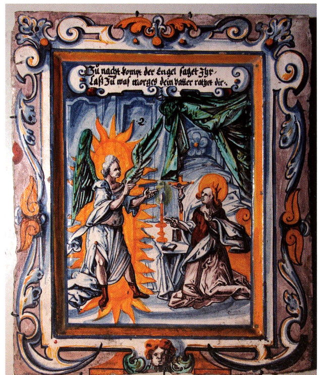
Abb. 41 Verkündigung an Maria (NT 2), um 1620. Hans Caspar Erhart, Winterthur, zugeschrieben. Schweiz. Landesmuseum Zürich. Inv. Nr. IN 6854

Im ersten Drittel des 17. Jahrhunderts liebte man dann überaus kräftige Umrahmungen. Ein typisches Beispiel ist der Ofen in Elgg 1607 ( Ofen 6 ). Hier bilden schon die grün glasierten Reliefkacheln einen starken farblichen Akzent, und die Bilder auf den Füllkacheln und den kleinen Frieskacheln unter dem Kranz sind dazu mit einer dunkelblauen Umrahmung eingefasst. Ähnliches gilt für den vollständig bunt bemalten Ofen in Luzern um 1610 ( Ofen 7 ), doch sind hier die Umrahmungen nicht einfarbig, sondern blau in blau mit Ornamenten bemalt. Bei weiteren Kachelserien nehmen die Rahmen die Farbigkeit der Bilder auf und setzen sich dadurch etwas weniger von ihnen ab. ( Abb. 41 )