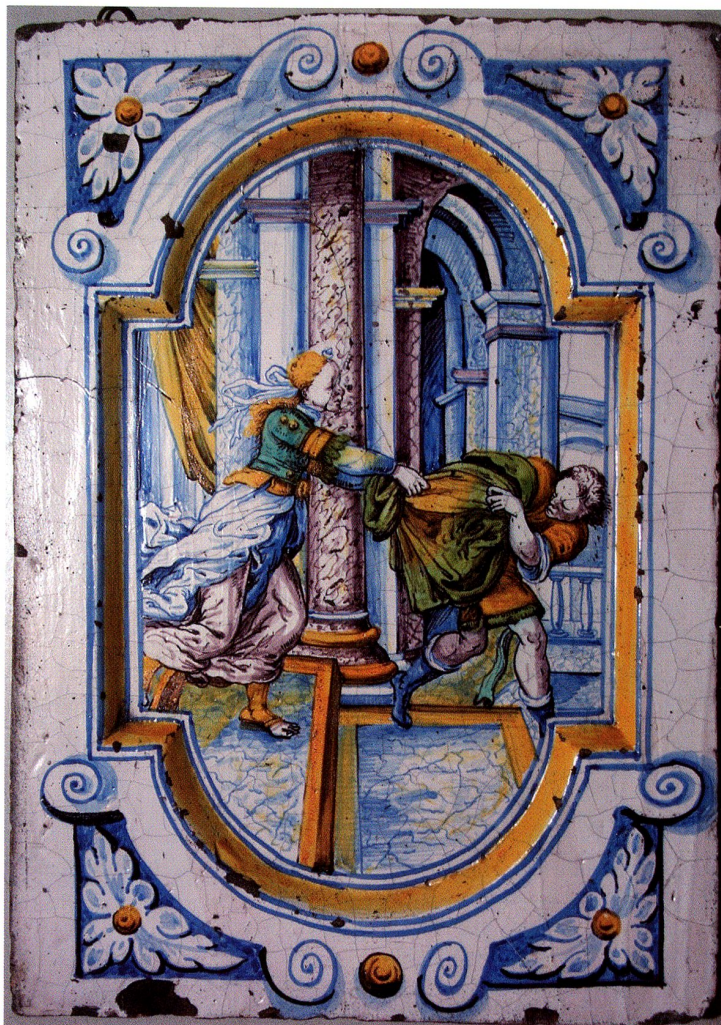
Abb. 42 Joseph und Potiphars Frau (AT 47) um 1690. Winterthurer Kachel. Schweiz. Landesmuseum Zürich. Inv. Nr. IN 103.55e

Bei den meisten frühen Beispielen sind die Umrahmungen deutlich architektonisch aufgefasst, als arkadenförmiges Portal mit seitlichen Pilastern, die von einem Kapitell abgeschlossen werden und den Bogen stützen. Die Form des Bogenportals wird neben anderen Formen noch bis ins dritte Viertel des 17. Jahrhunderts gepflegt. Wie ein reich gegliedertes Renaissancegebäude präsentiert sich der Ofenrest in Amsterdam ( Ofen 13, um 1645 ). Daneben verschwanden die glatten Füllkacheln nicht vollständig; sie wurden mit gemaltem Beschlägwerk umrahmt ( Ofen 12, Zürich Landesmuseum, um 1630 ) oder von farbigen Linien eingefasst ( Ofen 16, Lenzburg, 1665 ).