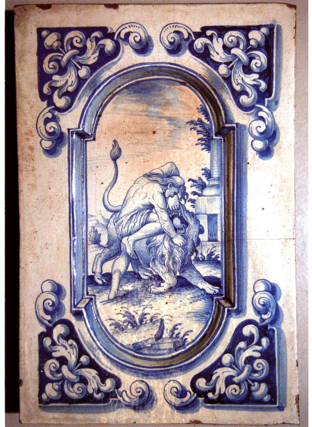
Abb. 43 Zwei Ofenkacheln, 2. H. 18. Jh. David Sulzer, Winterthur, zugeschrieben. Abrahams Knecht und Rebekka am Brunnen (AT 29). Simson und der Löwe (AT 100). Schweiz. Landesmuseum Zürich. Inv. Nr. IN 72/HA 3327, 3328

Die Steckborner Hafner übernahmen das Dekorationssystem, führten aber auch den ebenfalls vertieften rechteckigen Spiegel mit eingezogenen Ecken ein (vgl. Öfen Ofen 65 Bischofszell, 66 Warth, 72 Chur ). Auch bei den Zweipassformen verschwand im Allgemeinen gegen Mitte des 18. Jahrhunderts das Dreiblatt in den Zwickeln und machte barocken Rankenornamenten Platz. (Abb. 43)