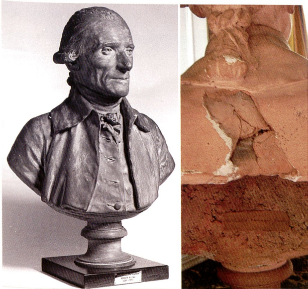
Fig 3: R. F. Grand, plâtre peint.