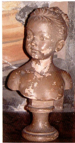
Fig 5: Louise Brongniart (plâtre teinté et peint, H. 39,5 cm).