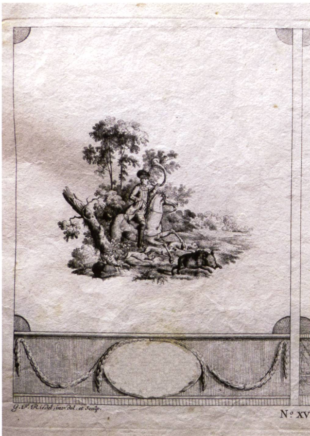
Abb. 10: Reiter mit Parforcehorn; Kupferstich von Riedel. 15,0 x 22,5 cm; Flach (2015), S. 68, XV, Blatt 6 linkes Bild.

Landenberger stellt zur Porzellan-Malerei auch einige von Riedel vermutete Meissener Arbeiten vor. 77 Sie beschränkt sich dabei auf Riedels Genremalereien. Hierbei wählt sie 13 Porzellan-Malereien aus, die sie Riedel zuschreibt. Ein Beispiel daraus soll hier gezeigt werden ( Abb. 7 ). Argumente für diese Zuschreibungen werden nicht gegeben; auch der Autor könnte keine bieten.