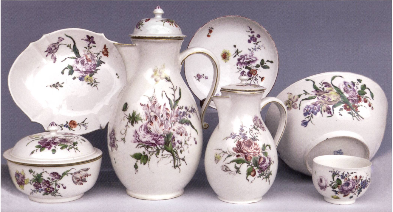
Abb. 11: Kaffeekanne, Milchkanne, Löffelschale, Kanne, Zuckerdose, Tasse und Untertasse eines Restservices für Kaffee, jeweils mit großer, alle mit lockerer, meist sehr gefächerter bunter Blumenmalerei; jeweils großes, harmonisches, mit seinem Spiegelbild ligiertes C unter Herzoghut und eisenrote oder purpurne Malerzeichen 'R' neben der Marke; um 1760. H Kaffeekanne 23,0 cm, Milchkanne 15,2 cm, L Löffelschale 17,3 cm, Ø Kanne 16,9 cm, Ø Zuckerdose 11,7 cm, H Tasse 4,6 cm, Ø Untertasse 13 cm; Privatbesitz.

bestätigt wird, dass er auch Bataillen gemalt hat, 86 schreckte Riedel vor keiner Malereigattung zurück. Wenn alles dies zutrifft, ist die breite Anerkennung Riedelscher Arbeiten mit der angeblichen Malerei Ringlers nicht zu vergleichen.