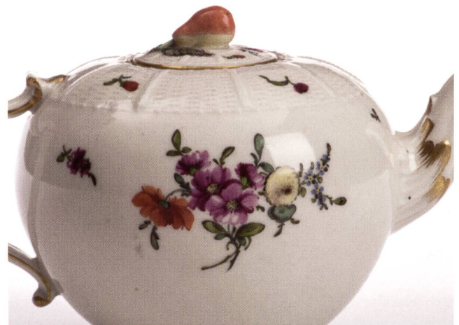
Abb. 4: Ausschnitte einer Teekanne mit Altozierrand und buntem Blumenstrauss, Streublümchen; H 11,5 cm, um 1765; © Landesmuseum Württemberg Stuttgart, Inv. Nr. WLM 2031a, Landenberger (1980), S. 38 Vitr. 17 Obj. 22-26.

beiden Bereiche bedeutete neue Daueraufgaben.