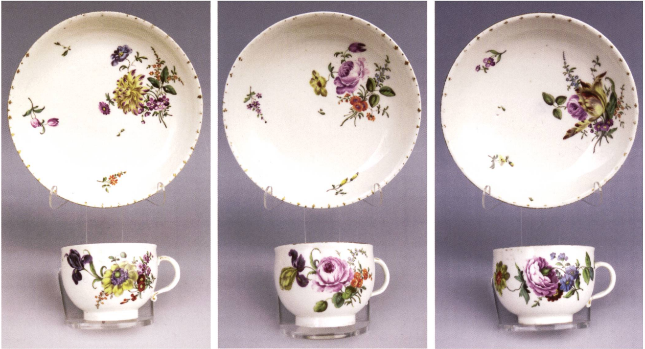
Abb. 2: Drei niedrige Tassen mit flachen Untertassen, alle mit buntem Blumenstrauß und Streublümchen wohl von Riedel; Tassen H 4,7-4,9 cm, UT Ø 13,2-13,5 cm, um 1760; Prov.: Sammlung Peter Heidelberg, Metz Heidelberg Auktion 25. März 2000, Los 152-154, Privatsammlung Stuttgart.