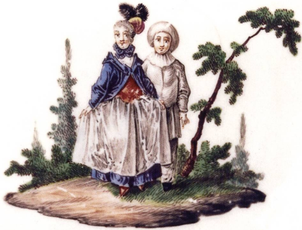
Abb. 13: Je ein stehendes Paar auf einer Inseldarstellung, Streublümchen; beide mit R-Signatur auf dem Boden; um 1759/60; Privatbesitz.

Die Signaturhöhen schwanken zwischen 2,8 und 3,2 mm. Bei einer Beurteilung der unterschiedlichen Buchstaben-Ausformungen bedenke man darum ihre kleinen Masse. Die Blumenmalereien des Restservices wurden schon bei dessen erstem Erscheinen in der Sammlerszene 1970 90 von Landenberger Ringler zugeschrieben. 91