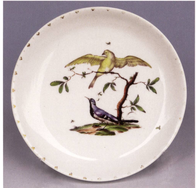
Abb. 8: Flache Untertasse mit Vögeln auf Baumast und Boden, Goldspitzenrand; Ø 13,1 cm, Riedel zugeschrieben; um 1760; Privatbesitz.

mit der erwähnten Ausnahme (siehe Punkt 6) nicht erfolgten, muss unterstellt werden, dass sie für dieses ihr Hauptwerk zurückgehalten worden waren. Damit fehlen zu ihren zahlreichen Ringler-Zuschreibungen akzeptable Begründungen. 61