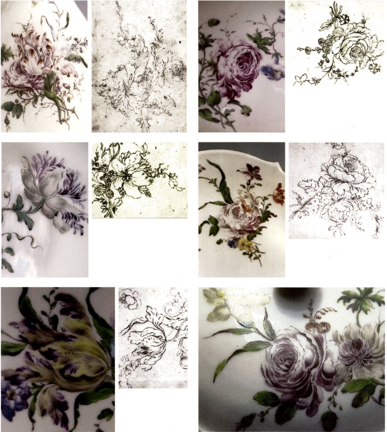
Abb. 12: Sechs Ausschnitte aus Malereien auf den Teilen des Restservices der Abb. 11 mit stilgleichen Ausschnitten aus den Zeichnungen aus dem zweiten Teil des Arkanabuchs. Schweizer Privatsammlung, Farbfotos des Besitzers.