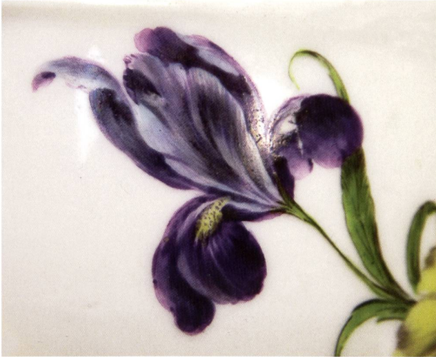
Abb. 15: Ausschnitt aus der Malerei der Tasse der Abb. 2.

manche der Blumenmalereien der Stücke 8 bis 12 der Tabelle Oettner-Anklänge besitzen, andere aber eindeutig höherer Qualität sind. Vgl. die Iris aus Tabellen -Nr. 10 (Abb. 15);