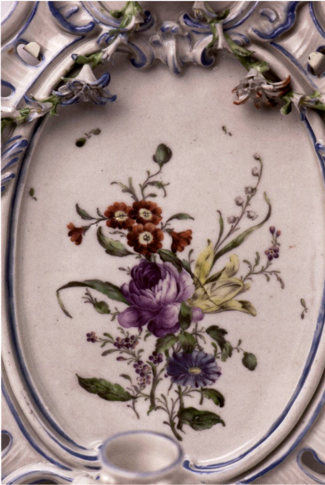
Abb. 5: Blumenstrauss auf einem Wandleuchter; um 1775, H 48 cm; © Landesmuseum Württemberg Stuttgart, Inv. Nr. WLM 1946-23, Landenberger (1980), S. 19 Vitr. 7 Obj. 2.