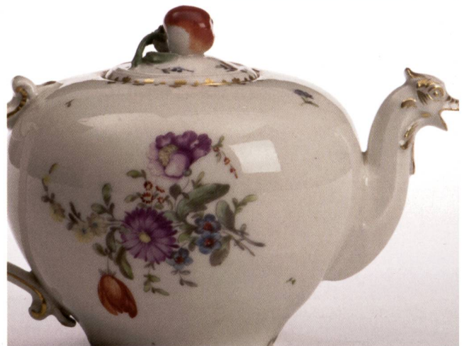
Abb. 6: Ausschnitte einer Teekanne mit Blumenstrauss, Ausguss mit Drachenkopf; H 10 cm, um 1765; © Landesmuseum Württemberg Stuttgart, Inv. Nr. WLM 14082, Landenberger (1980), S. 11 Vitr. 1 Obj. 14.

7. Fast alle hier von Landenberger vorgestellten Ringler-Malereien sind Zuschreibungen ohne erwähnte Begründungen. Sichere Argumente zu Ringlers Arbeiten fehlen bisher mit einer Ausnahme – siehe Nr. 5 – völlig, so dass sich hier schon die Frage stellt: hat Ringler überhaupt auf Porzellan gemalt? Dieser Frage folgt: wie konnte Landenberger überhaupt auf Ringler als Maler vieler Blumenmalereien kommen, wo doch hierfür eine grundlegende, feste Bestimmung, am sichersten durch eine Signatur oder aber andere Grundlagen, notwendig wäre? Als Begründung all ihrer Annahmen hat Landenberger nur eine vorgenommen: Sie hat den Stil der Zeichnungen in den Arkanabüchern (siehe unten) verglichen mit Malereien auf Porzellan, die sie entsprechend Ringler zuschrieb, weil sie basierend auf Ducrets Veröffentlichungen Ringler diese Zeichnungen zuschrieb. Auch hierzu unten Näheres.