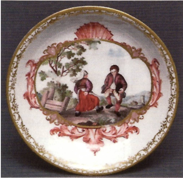
Abb. 7: Meißener Untertasse mit Tänzerpaar in bunter Malerei, Golddekor; um 1745, Ø 12,9 cm; Riedel zugeschrieben von Landenberger; Privatbesitz.