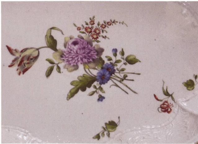
Abb. 3: Ausschnitte zweier Ovalschälchen mit heller Farbgebung, um 1775; oben Inv.Nr. WLM 1946-150 (Maße 25 x 19,3 cm), unten WLM 12844 (Maße 28 x 19 cm), beide: © Landesmuseum Württemberg Stuttgart, vorgestellt und Ringler zugeschrieben in: Landenberger (1980), S. 38 Vitr. 17 Obj. 21+31.