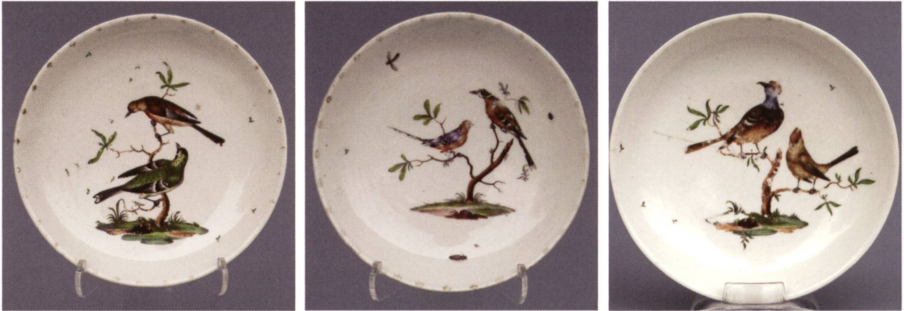
Abb. 9: Drei Untertassen in Kugeloberflächenausschnittform mit bunter Malerei mit je drei Vögel auf Baumästen, Goldspitzenrand; Ø 13,0-13,4 cm; 1760; Riedel zugeschrieben; Privatbesitz.