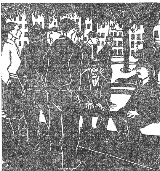
Arbeitslose, Zürich 1933

Im zweiten Band der «Roten Welles» schreibt Helmut Zschokke über «Die Schweiz und der Spanische Bürgerkrieg». Der Autor war damals selbst aktiv tätig für die spanische Republik und musste sein Engagement mit einer zehmonatigen Gefängnisstrafe und dem Ausschluss aus der Universität Zürich bezahlen. Zschokke untersucht die Haltung der «offiziellen» Schweiz (Bundesrat Motta, «NZ» usw.), und es ist ihm nicht schwer, die unwillkürlichen Sympathien eines grossen Teils des Bürgertums für die faschistischen Aufständischen zu belegen. Im krassen Gegensatz dazu stand das überzeugte Engagement der Arbeiterbewegung für die Volksfrontregierung. Neben der Spitze der 700 militanten Antifaschisten, die in Spanien in den In-