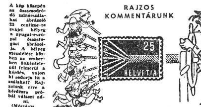
Dieses aus dem ungarischen Parteiblatt «Népszabadság» stammende Beispiel kommunistischer Hetze stellte uns freundlicherweise die Osteuropa-Bibliothek von Dr. P. Sager, Bern, zur Verfügung.