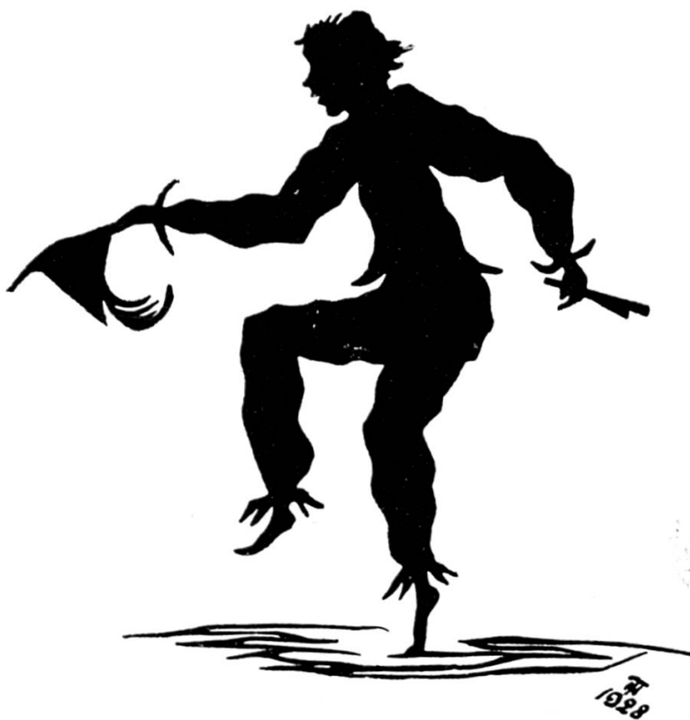
Scherenschnitt von T. H. (1928)

Wer hat dich wohl gestern betört, wer hat deinen Gleichmut gestört? Wer hat dir gestern geschmeichelt, geherzt Dich wohl gar und gestreichelt? So sprich doch: wer hat dich entzückt, wem ist dieses Wunder geglückt? Wem warst du gestern so nah, dass – fürcht' ich – ein Unglück geschah? Du trägst dort am Hals einen Flecken seit heute und willst ihn verstecken! Du lachst! – Sag, ist wirklich es wahr, dass nur das Tätzchen von euerm Kätzchen es war?