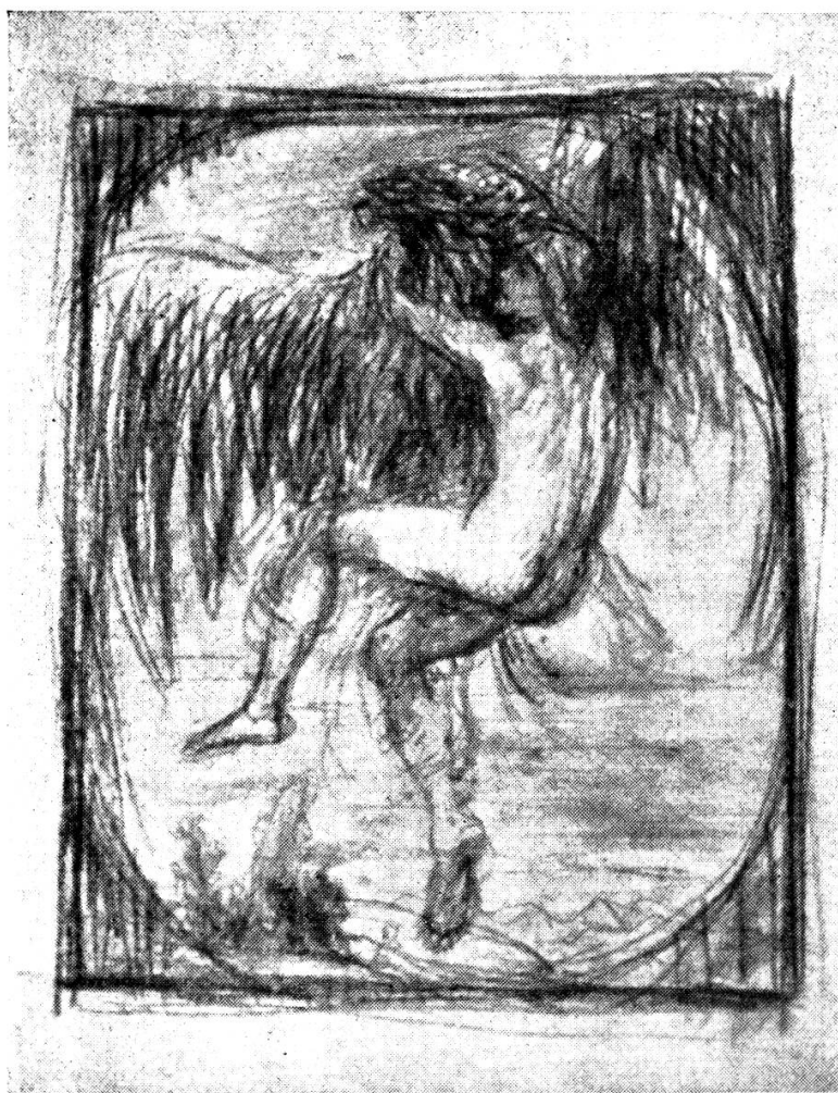
Dessin de Hans von Marées, 1887.

te tue». Le coeur de Ganymède tomba comme une pierre au fond de sa poitrine et lorsque le soir Alexis s'éloigna, il ne trouva même pas la force de pleurer. Les temps étaient révolus. Cléone, Callicrate étaient partis les premiers; l'esprit de Lycidas était mort avant sa pauvre dépouille; Alexis, qu'il avait sauvagement appelé diminuait maintenant sur le chemin de son foyer, le flot s'était retiré, ne laissant après lui qu'une solitaire amertume. Ganymède jeta sa tunique à terre et se dressa, nu, vers les étoiles. «O, Dieux, s'écria-t-il, qui m'avez donné ce corps dont la