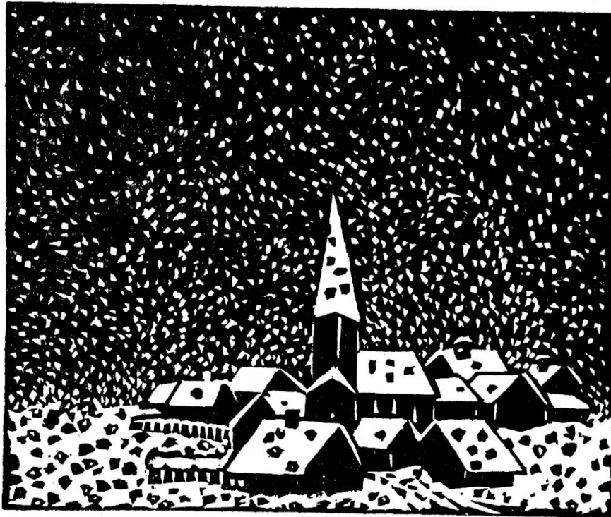
Holzschnitt von Frans Masareel