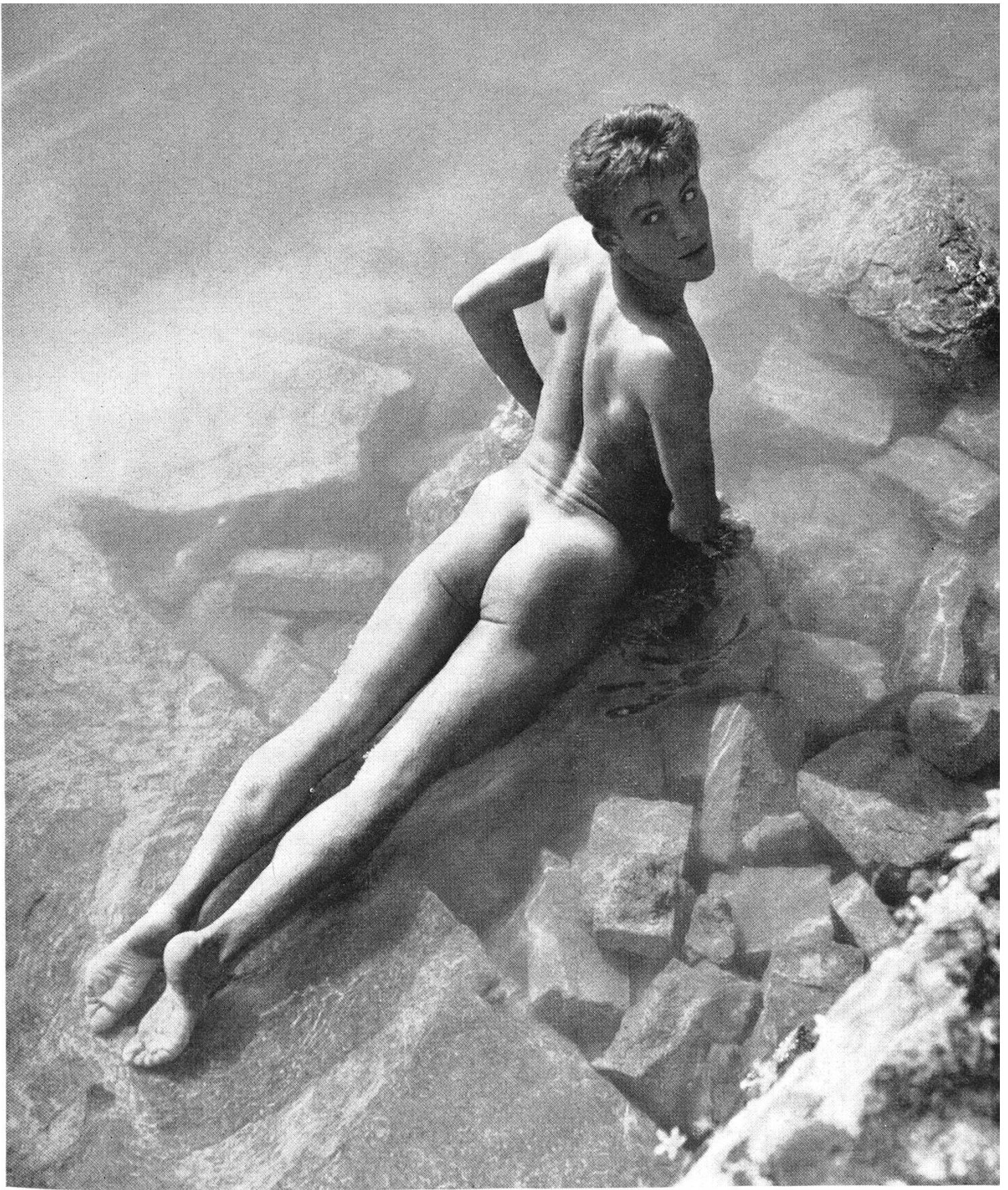
Zwei Aufnahmen von Arfe, Zürich