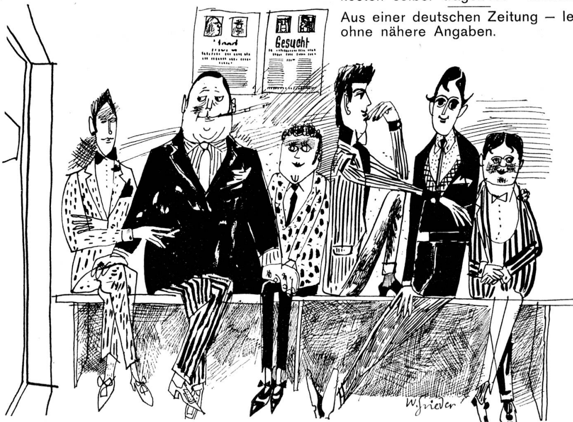
Männer-Milieu — — — vor der Vernehmung

Aus einer deutschen Zeitung – leider ohne nähere Angaben.