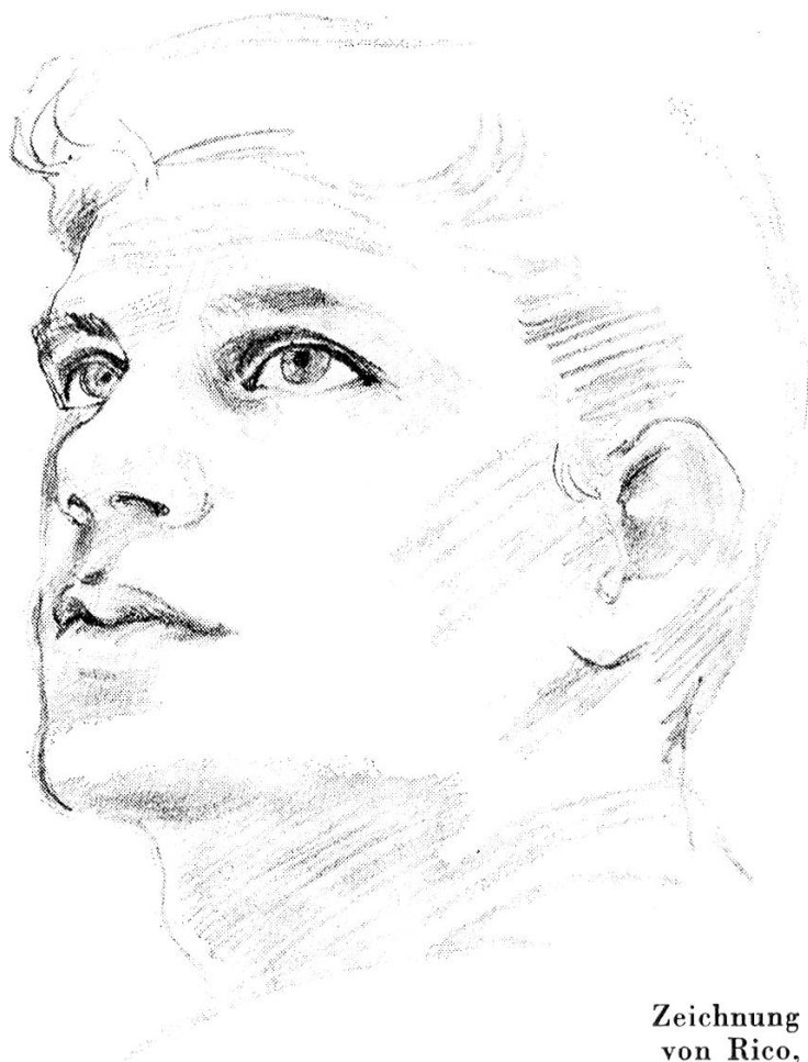
Zeichnung von Rico, Zürich