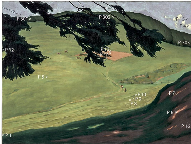
Abb. 204 Lage der Mess- und Probeentnahmestellen