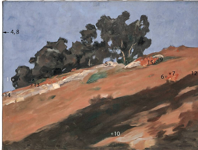
Abb. 199 Lage der Mess- und Probenentnahmestellen