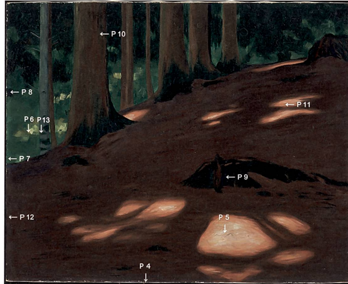
Abb. 201 Lage der Mess- und Probeentnahmestellen