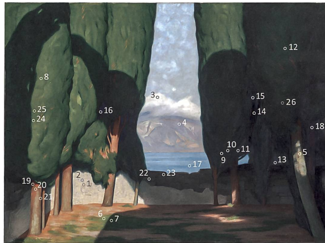
Abb. 200 Lage der Mess- und Probeentnahmestellen