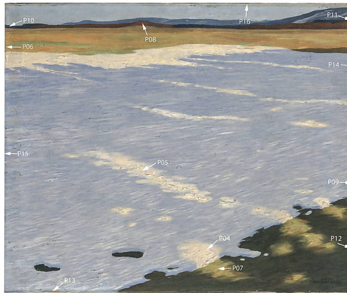
Abb. 205 Lage der Mess- und Probenentnahmestellen