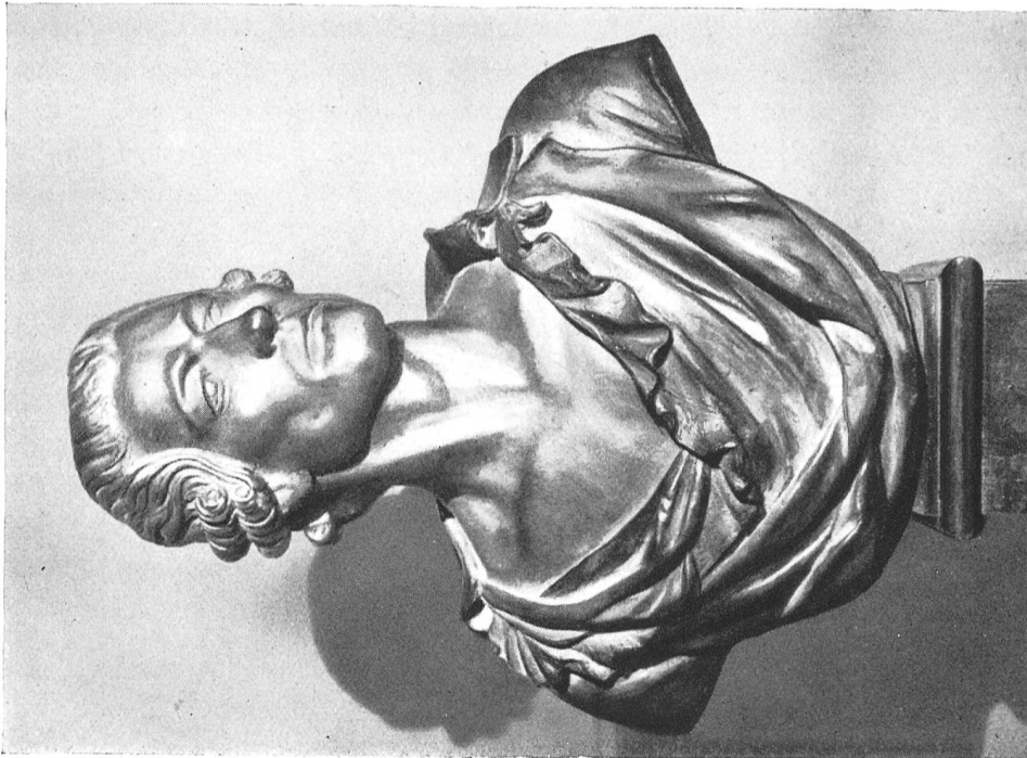
Buste de MELCHIOR WYRSCH par F. KAISER Apt. à M. Zelger à Lucerne