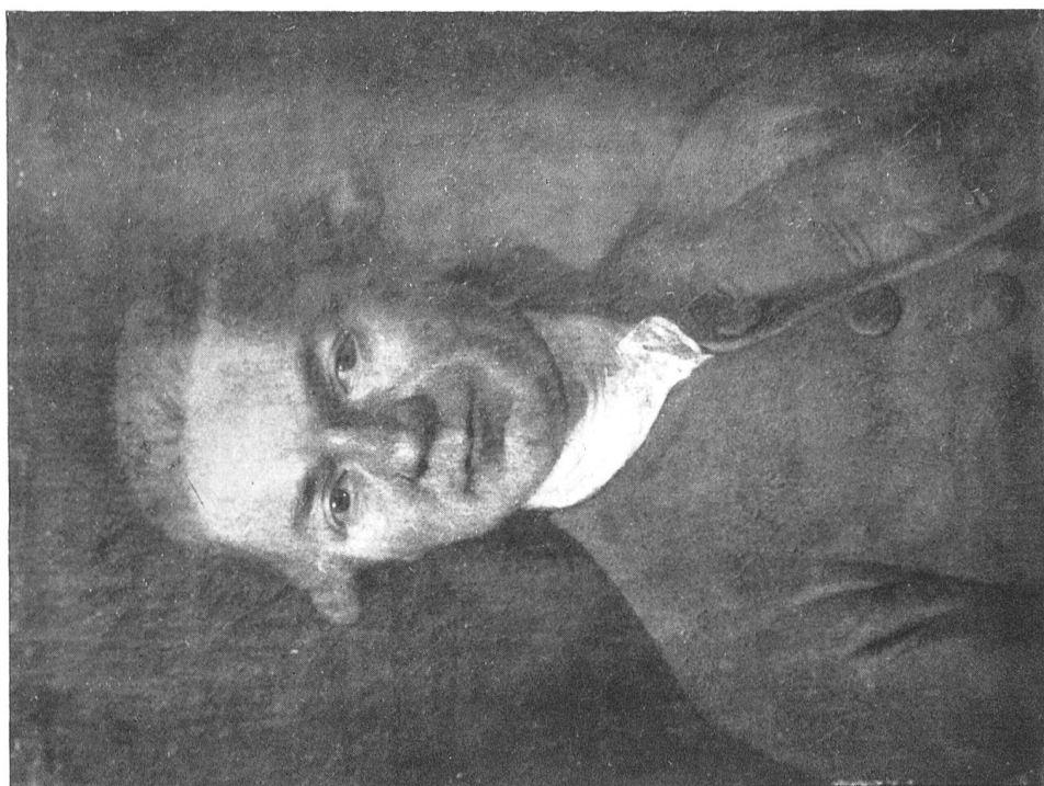
Portrait de MELCHIOR WYRSCH Musée de Besançon