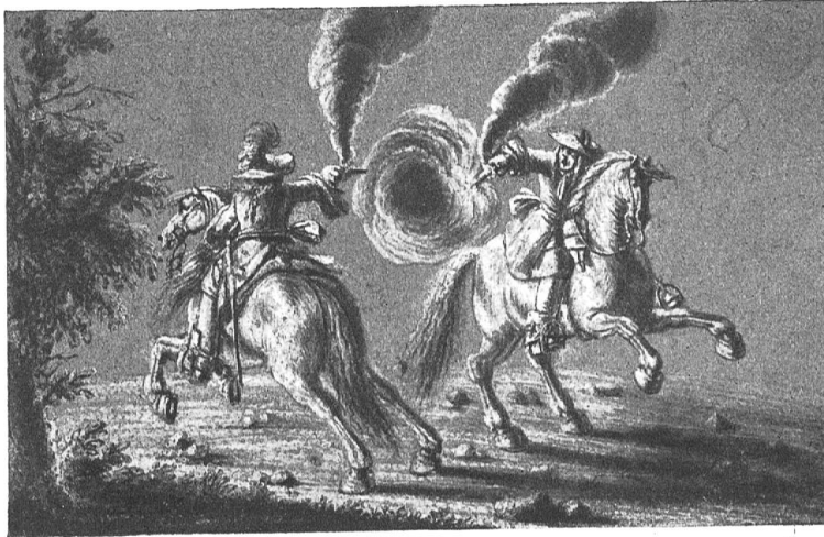
J. H. WERDMÜLLER Tuschzeichnung, weiss gehöht