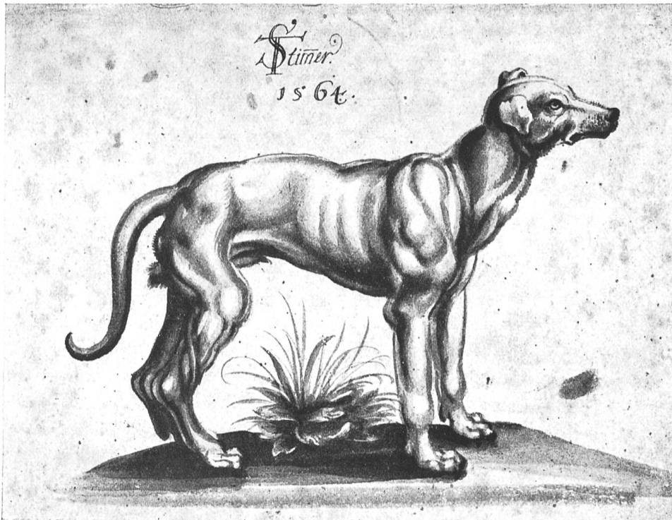
TOBIAS STIMMER Tuschzeichnung dat. 1564