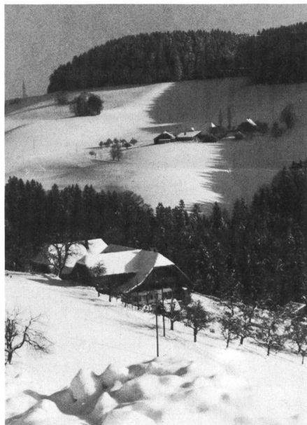
Diese Betriebe sind wohl auch nicht «europafähig» . . .

Freier Welthandel, so wie er von vielen Gatt-Ländern verstanden wird, ist umweltbelastend und läuft allen Bestrebungen zur Erhaltung der Lebensgrundlagen auf unserem Planeten zuwider. Freier Welthandel bringt doch mehr Verkehr in allen Richtungen. Für Erzeugung und Transport werden mehr Rohstoffe und mehr Energie aus den Reserven unserer Erde verbraucht. Niemand wird und kann auch nur das geringste tun, um die Reserven wieder aufzufüllen. Wir sind damit auf einer Einbahnstrasse.