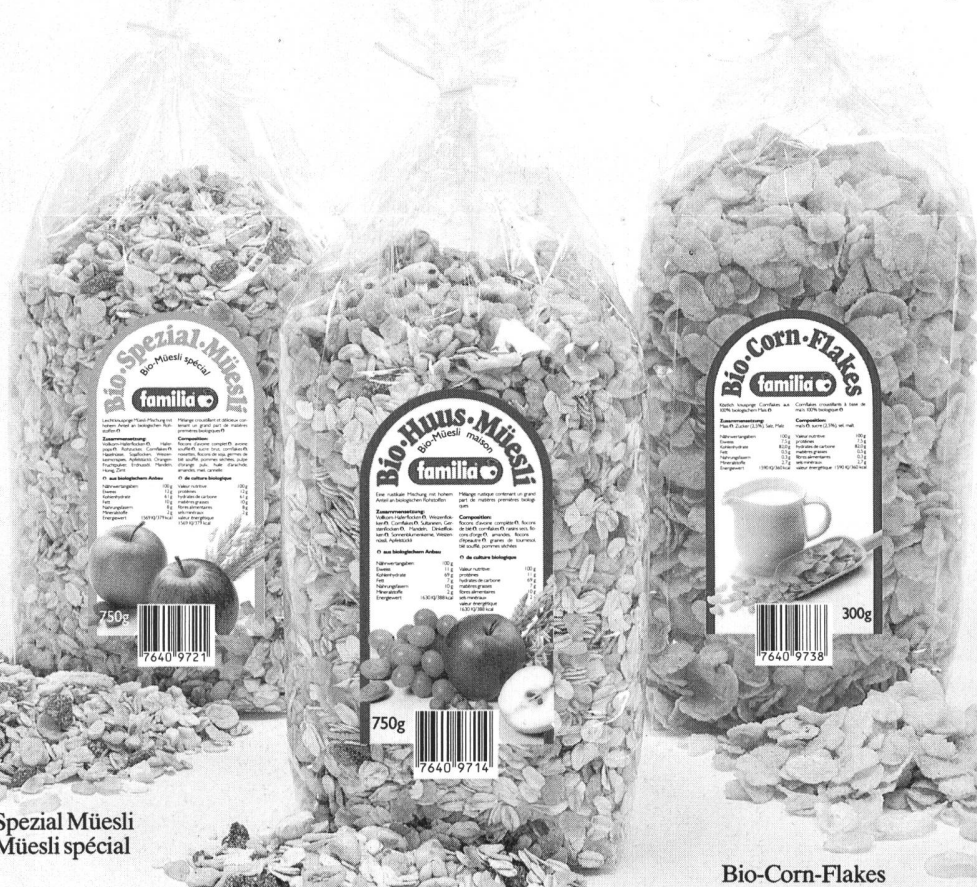
Bio-Spezial Müesli Bio-Müesli spécial

beaucoup des matières premières biologiques, emballage simple