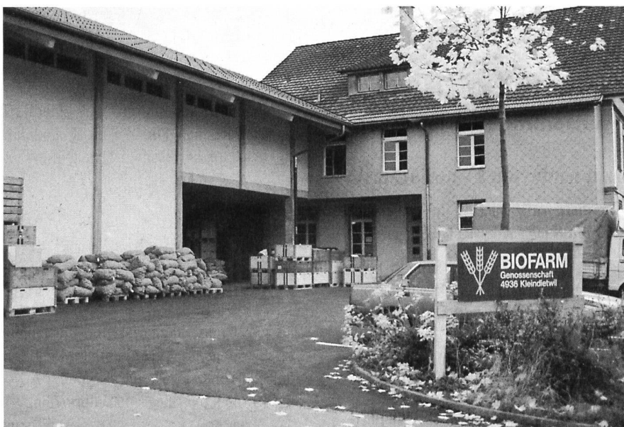
Der Neubau ist gefällig und zweckmässig.

Seit einigen Jahren bieten wir ein Legehennen-Alleinfutter an, das die Anforderungen der VSBLO-Richtlinien für «Knospen-Eier» erfüllt. Mit diesem Futter, das ursprünglich eher für Hobby-Hühnerhalter konzipiert wurde, konnten indes nicht alle Anforderungen einer gewerbmässigen Eierproduktion erfüllt werden. In enger Zusammenarbeit mit Fütterungsspezialisten haben wir das Sortiment so ausgebaut, dass für jeden Betrieb die passende Lösung gefunden werden kann. Für grössere Betriebe mit eigenem Futtergetreide (vor allem Mais), können wir