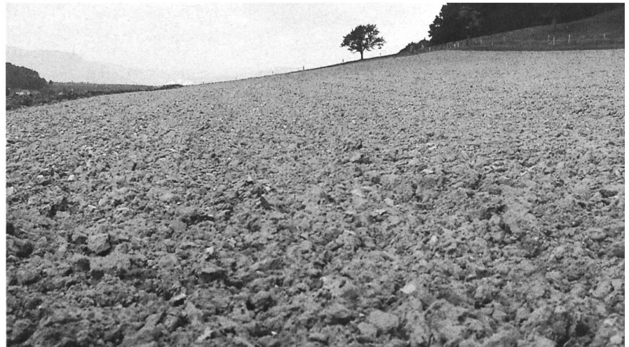
Wenn dieses Feld bis zum Frühjahr so liegen bleibt, gehen grosse Mengen Stickstoff verloren.

Wird eine Narbenzerstörung, zum Beispiel mit dem Grubber, vor dem Einsatz des Pfluges durchgeführt, lässt sich die Stickstoffmineralisation im Herbst dadurch begrenzen, dass der Zeitraum zwischen Narbenzerstörung, Pflugeinsatz und Einsaat der Nach-