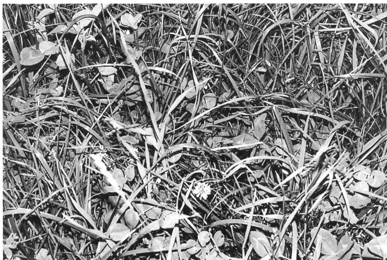
Gräser entziehen dem Boden den von den Leguminosen nicht genutzten Stickstoff.

Leguminosen decken ihren Stickstoffbedarf zum grössten Teil über die symbiontische Stickstoff-Fixierung aus der Luft. Dies führt vielfach dazu, dass Leguminosen nur geringe Mengen Stickstoff in mineralischer Form aus dem Boden aufnehmen. Liegen beispielsweise vor Anlage von Leguminosen-Beständen bereits höhere Mengen mineralischen Stickstoffs (Nitrat- und Ammoniumstickstoff) im Boden vor, so werden diese bis zum Vegetationsende häufig nur unzureichend von Leguminosen-Reinbeständen aufgenommen. Während der Vegetationsperiode kann zusätzlich organisch gebundener Stickstoff aus Humusvorräten bzw. aus Bestandesabfällen der Leguminosen im Boden mineralisiert werden. Beide Effekte können dazu führen, dass zu Vegetationsende im Boden erhöhte N_{min} -Mengen unter Leguminosen-Reinbeständen vorliegen, die je nach Standortgegebenheiten über Winter auch ausgewaschen werden können. Bei Ackerbohnen, die aufgrund ihres Pfahlwurzelsystems den Boden nicht gleichmässig verteilt durchwurzeln können, besteht zusätzlich die Gefahr, dass