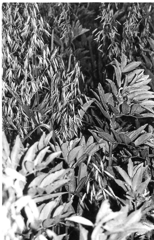
Für die Stickstoff-Optimierung ist es vorteilhaft, den Ackerbohnen Hafer beizumengen.

Bei der Anlage von Futterleguminosen-Beständen (Haupt- oder Zwischenfrüchten) ist weiterhin zu berücksichtigen, dass nur solche Futterleguminosen die Gewähr für niedrige Stickstoffauswaschungsraten bieten, die bereits im Ansaatjahr einen wüchsigen und geschlossenen Bestand bis zum Vegetationsende gebildet haben. Um dies zu erreichen, sollten stets standortangepasste Gras- und Leguminosenarten sowie geeignete Sortenkombinationen angesät werden. Ferner ist