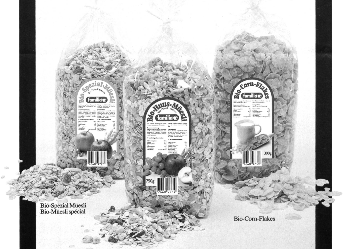
Bio-Spezial Müesli Bio-Müesli spécial

beaucoup des matières premières biologiques, emballage simple