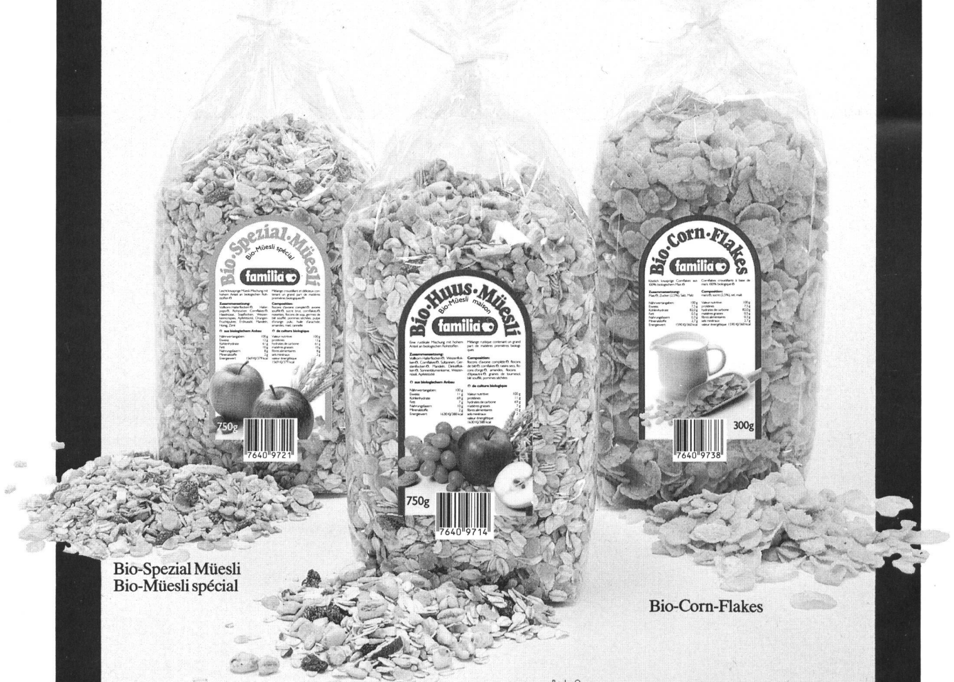
Bio-Spezial Müesli Bio-Müesli spécial

beaucoup des matières premières biologiques, emballage simple