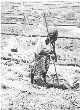
Bäuerinnen errichten kleine Steinwälle und schützen dabei ihre Böden davor, vom oberflächlich abfließenden Regenwasser weggeschwemmt zu werden.

Rechnung zu tragen ist, entwickelt und angewandt. Sie sieht sich in nachkolonialer Zeit starken, kaum beeinflussbaren, externen wirtschaftlichen wie auch politischen Einflüssen gegenüber.