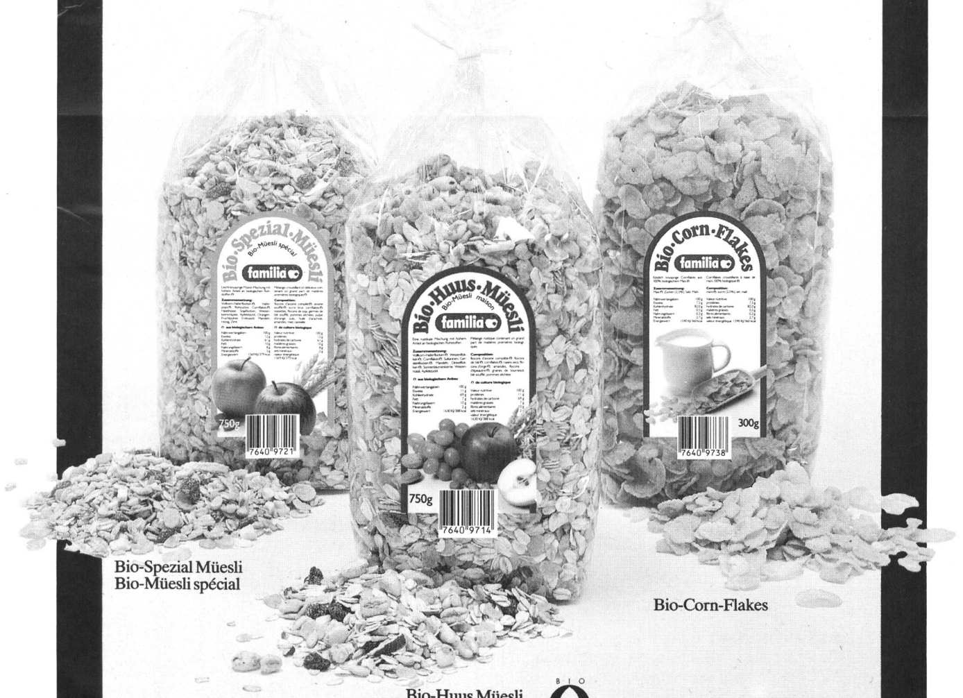
Bio-Spezial Müesli Bio-Müesli spécial

beaucoup des matières premières biologiques, emballage simple