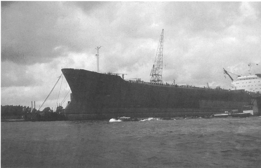
Durch die vom Gatt verlangte Öffnung und Globalisierung der Märkte wird die Schweizerische Landwirtschaft durch billigere Importe des Weltmarktes unter vermehrten Kostendruck gesetzt.

lichen Produzenten und der Bewohner/Konsumenten muss in breit zu fördernden Gesprächsgruppen oder Foren Bauern-Bürger geschaffen werden. Wesentlich ist, dass es dabei nicht um eine Erhaltung der Landwirtschaft an sich geht. Es geht darum, dass gerade durch die Landwirtschaft die Bewohner sich ein stabiles Verhältnis zu ihrer Umwelt sichern können. Deshalb ist die bäuerliche Landwirtschaft für die Agglomerationen lebenswichtig. – Die Agglomerationsentwicklung hat einen die Landwirtschaft und den Gesamttraum verändernden Einfluss, der kritisch nachgezeichnet wird. Ob dieser Prozess in Form eines weiterlaufenden Agglomerationsprozesses Bestand hat, ist mehr als fraglich. Wesentliche Argumente, die heute gegen die bäuerliche Landwirtschaft angeführt werden, basieren auf der inneren Logik des Agglomerationsprozesses. Eine kritische Auseinandersetzung mit dem Sinn dieser Entwicklung entzieht auch der heutigen Agrarkritik auf weite Strecken den Boden.