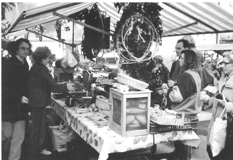
Direktverkauf als erste Kommunikations- und Kontaktstelle zwischen Bauern und Agglomerationsbewohnern.