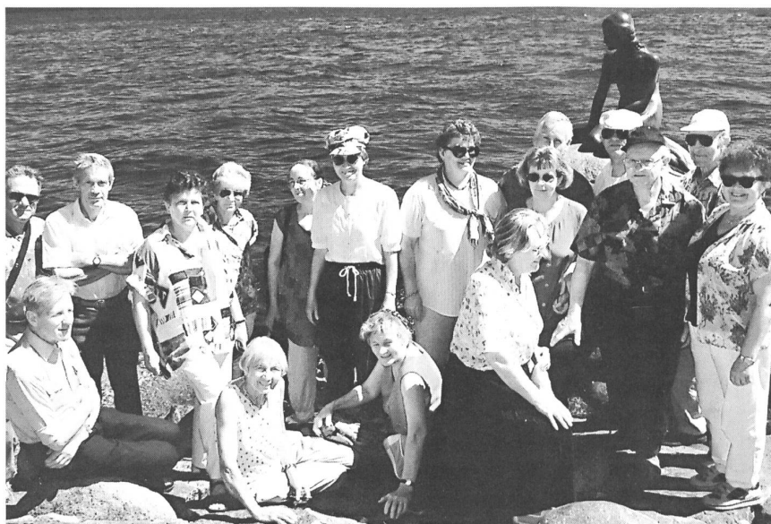
Unsere Reisegruppe vor dem meistfotografierten Mädchen der Welt, der Kleinen Meerjungfrau.

In Dänemark gibt es ungefähr 100 Heimvolkshochschulen. Sie finden sich über das ganze Land verstreut. Die meisten Schulen liegen in ländlicher Umgebung oder in Kleinstädten, und das Typische ist, dass sie nach der Gegend, wo sie liegen, benannt sind. Einige Schulen sind alt, andere neueren Datums. Einige sind gross und bieten Platz für an die zweihundert Schüler. Andere können höchstens 30 Schüler aufnehmen. Die einen stehen finanziell gut – andere wiederum nicht. Wenige Schulen sind architektonische Glanzstücke – die meisten sind von einem wahren architektonischen Stilgemisch.