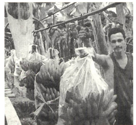
Beinahe wie zu Zeiten der Sklaverei: Der Bananenzug in der Bananenplantage

Es sind Tausende im Land, die steril geworden sind. Unfruchtbar sein in einem Land, wo Familie alles und Manneskraft ein Leistungsausweis ist, nimmt dem Leben seinen Sinn. Die Banane ist gerecht – in zynischem