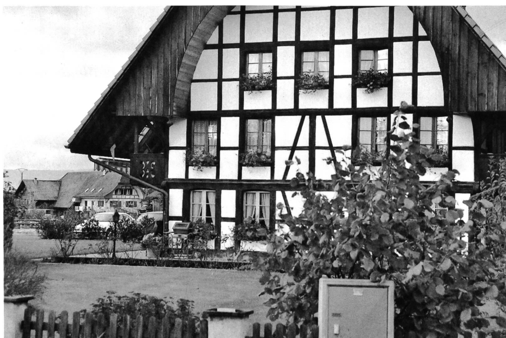
Das alte Bauernhaus ist ein Schmuckstück im Dorf

Front dagegen gestemmt. «Es durfte doch nicht sein, dass wir nur noch Rohstofflieferanten geworden wären, ohne jeglichen Einfluss auf den Handel und auf Gedeih und Verderben der jeweiligen Laune eines Einkäufers ausgeliefert. Das ist einer der Gründe, warum ich mich für die