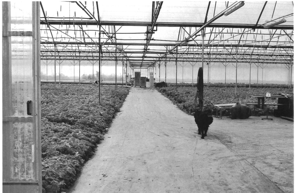
Hier ist rationelles Arbeiten möglich

Bio-Gemüse AV AG als Handelsorganisation in bäuerlicher Hand engagiere. Als Genossenschaftler, resp. jetzt als Aktionär hat meine Stimme dort mehr Gewicht als beim privaten Händler. Aber, und das ist wichtig, dieses Gewicht darf keinen Einfluss haben auf die Qualität meiner Pro-