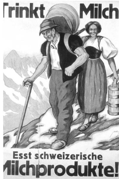
Milchwerbung im Wandel der Zeit. Standen in der Zwischenkriegszeit noch die Produzenten im Vordergrund, so wurden nach dem 2. Weltkrieg das Nahrungsmittel und seine Zubereitung ins Bild gerückt. Seit den 1980er Jahren verschwindet auch das Produkt weitgehend aus dem Blick. Es wird zunehmend zum Rohstoff.

schaft – und damit eine Entfremdung von Konsument/innen und Produzent/innen. Sie haben ob der Politisierung der Agrarpolitik ihre gemeinsamen Nutzungsinteressen im Ernährungsbereich weitgehend aus den Augen verloren.