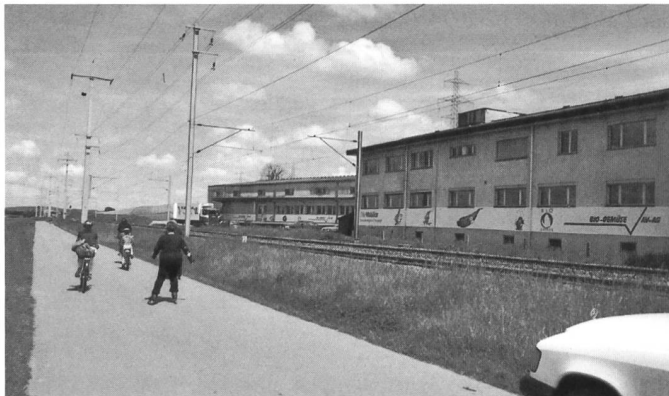
Die AV-AG Betriebs- und Bürogebäude liegen direkt am HPM-Weg der Expo 02. Ein Expo 02-Event, welches im Gegensatz zu praktisch allen anderen nach der Ausstellung nicht abgerissen wird, sondern weiter bestehen bleibt und an die Landesausstellung erinnern wird.

*HPM Human Powered Mobility Mit Muskele und Muskelkraft ans Ziel kommen – das ist Inhalt des HPM-Projektes der Expo.