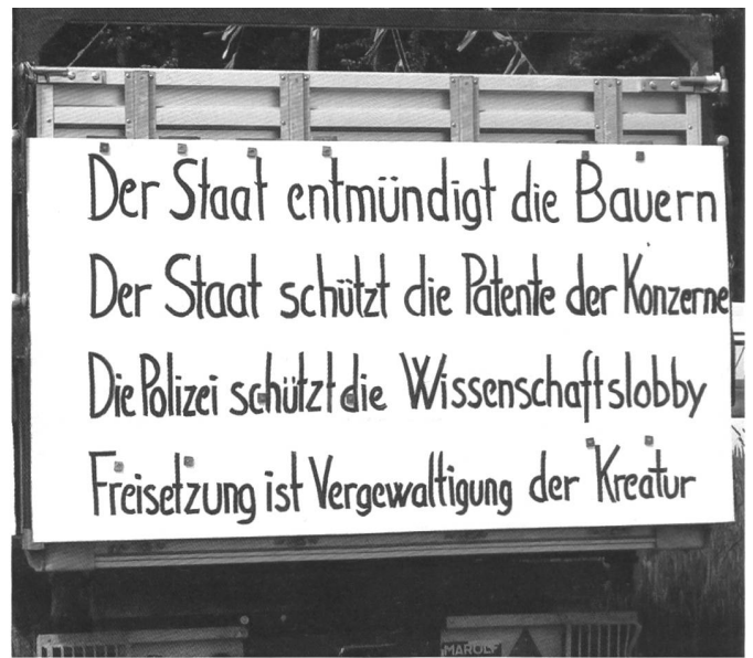
Mehrere Bauern vermittelten die Botschaft auf ihre Weise.