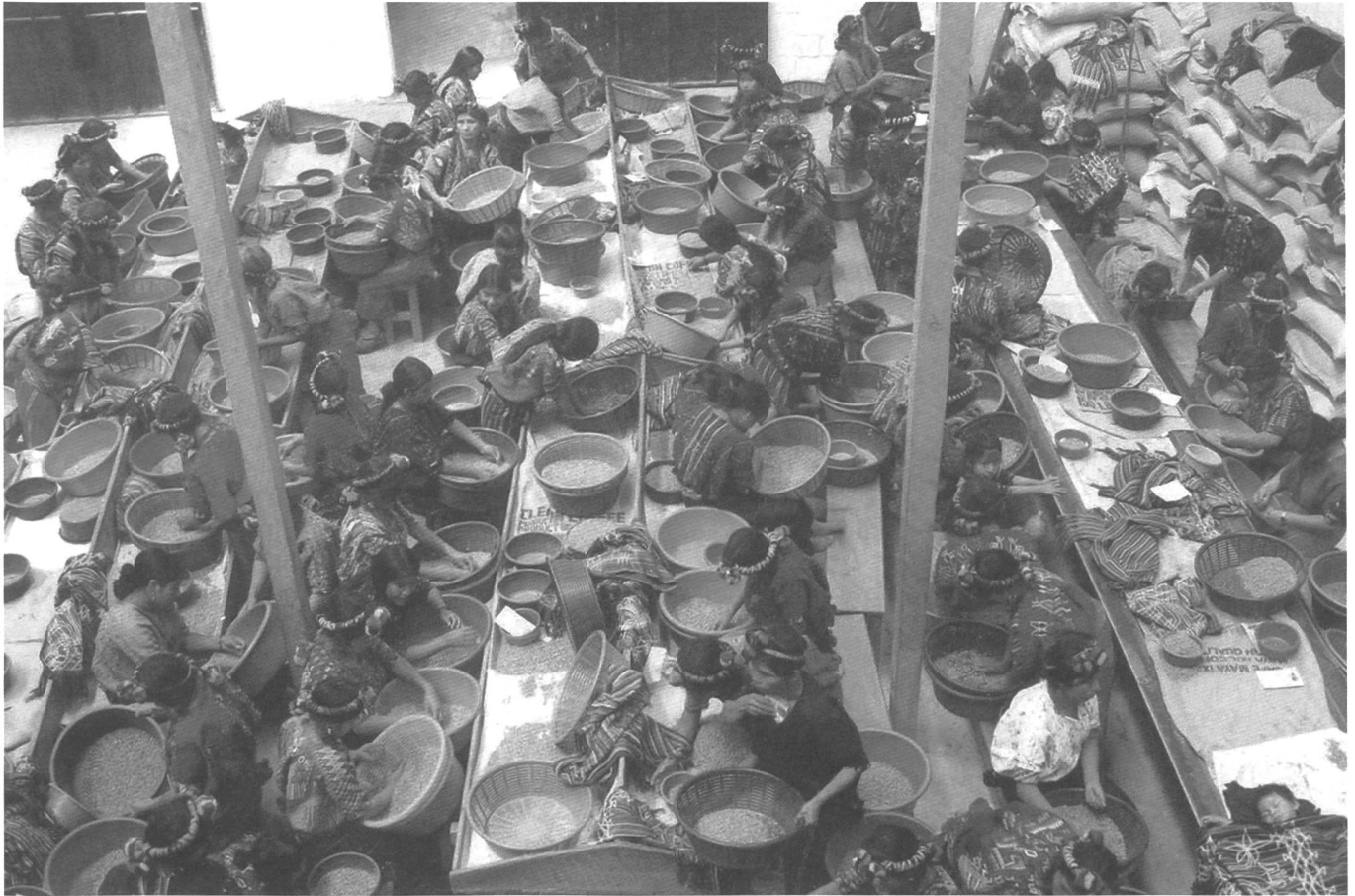
Auch in dieses Projekt in Chajul hat Oikocredit investiert: nicht Maschinen, sondern Menschen sortieren hier die Kaffeebohnen.

Finanzstrukturen ist es für Oikocredit möglich, auch ganz arme Bevölkerungsschichten zu erreichen. Das von den Vereinten Nationen für 2005 auserufene Internationale Jahr des Mikrokredits will die Bedeutung solcher Kleinstdarlehen weltweit bekannter machen und ihre Effekte für die Überwindung von Armut nutzen.