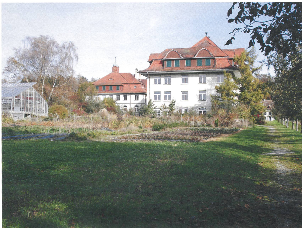
Hier soll der neue Nabel der Schweizer Biobewegung wachsen: auf der Schwand bei Münsingen.

sich für den Biolandbau einsetzt und eine nachhaltige Investitionspolitik betreibt. Damit kamen wir endlich in die Ränge! Kurz vor Weihnachten 2005 beschloss der Regierungsrat des Kantons Bern, das Projekt Bio Schwand ernsthaft zu verfolgen und das Führen von offiziellen Verkaufsverhandlungen einzuleiten.