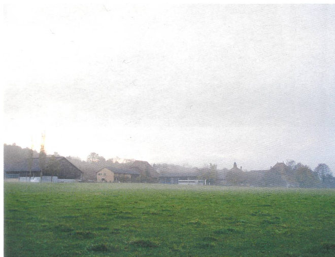
Lange Zeit im Nebel: vom Golfball zur Schwand mit Bio. Aber jetzt!

Der Verein wuchs schnell und betrieb lustvoll beste politische Basisarbeit. Vereinsmitglieder verteilten den Pendlerinnen und Pendlern am Bahnhof Münsingen Znüniäpfel. Ihr Slogan «Äpfel statt Golfbälle» wurde zum Leitstern einer Abstimmungskampagne, die bis zu den