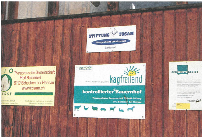
Der therapeutische Hof Baldenwil liegt hoch über Herisau.

Schon eine ganze Reihe junger Menschen hat auf dem Hof Baldenwil, der am steilen Nordhang oberhalb von Herisau liegt, das Bauern gelernt. Eine normale Lehre lag für die psychisch belasteten Jugendlichen ausser Reichweite. Auf dem Hof, der zur Stiftung Tosam gehört, erhielten sie die Chance, sich für die Berufswelt vorzubereiten. Das Ziel wäre eigentlich, dass sich die Ausgebildeten danach in den regulären Arbeitsmarkt integrieren. Doch eine