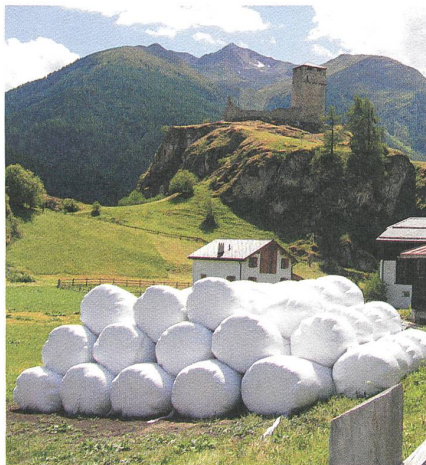
Statt immer intensiver wirtschaften, mit Vielfalt punkten.