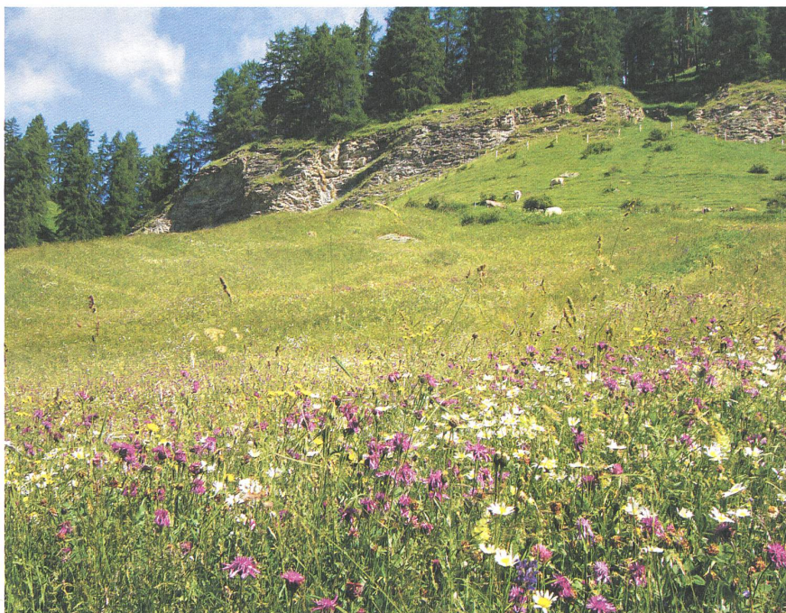
In Ardez im Unterengadin lohnt es sich, auf extensive Bewirtschaftung zu setzen.

«Bauern und Bäuerinnen, meldet Eure Erfahrungen zum Ökoausgleich.» Auf diesen Aufruf hat K+P nur von einem einzigen Bauern eine Zuschrift erhalten. Die Redaktion hat deshalb zusätzlich Bauern, die sich am FiBL-Projekt «wildtierfreundliche Landwirtschaft» beteiligten, um Erfahrungsberichte gebeten.