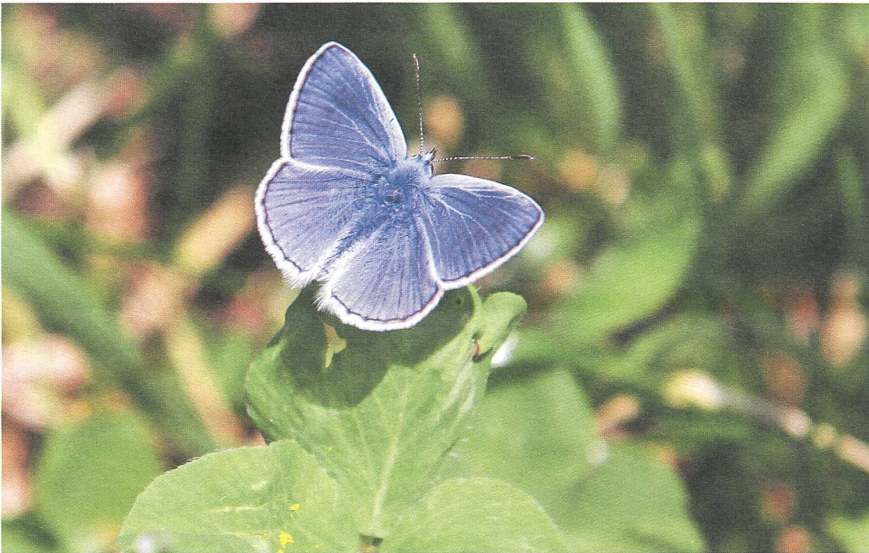
Bei der Blumen-Insel taucht prompt ein Bläuling auf.

einem Bruchteil der damaligen Hofbewohner bewältigt werden. Da reicht es vielfach mit dem besten Willen nicht mehr, dieses vielfältige Potenzial auszuschöpfen, wenn die Äpfel in der Migros billiger sind als die Handarbeit kostet, und der Most selbst in der Getränkeabteilung der Landi nur eine Randerscheinung ist. Aber nun noch grundsätzlich zur Frage der Multifunktionalität: Ich lege das Schwergewicht nach wie vor auf die Lebensmittelproduktion. Es kann durchaus sein, dass diese in nicht allzu ferner Zeit gewissermassen von Amtes wegen wieder gefördert und gefordert wird. Denn wie lange lassen es sich Länder mit Millionen hungernder Menschen noch gefallen, dass Grossfarmen in die reichen Länder exportieren, derweil die eigene Bevölkerung nicht das Allernötigste hat? Aber ich bin