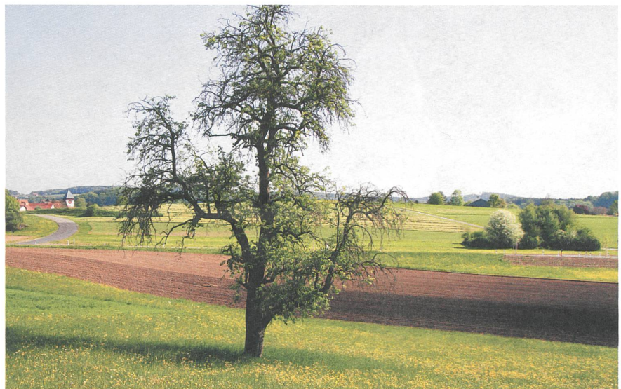
Der Natur bleiben kleinste Inseln im intensiv bewirtschafteten Kulturland.