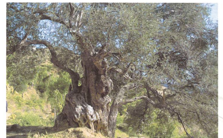
Älter als wir alle, voller junger Früchte...