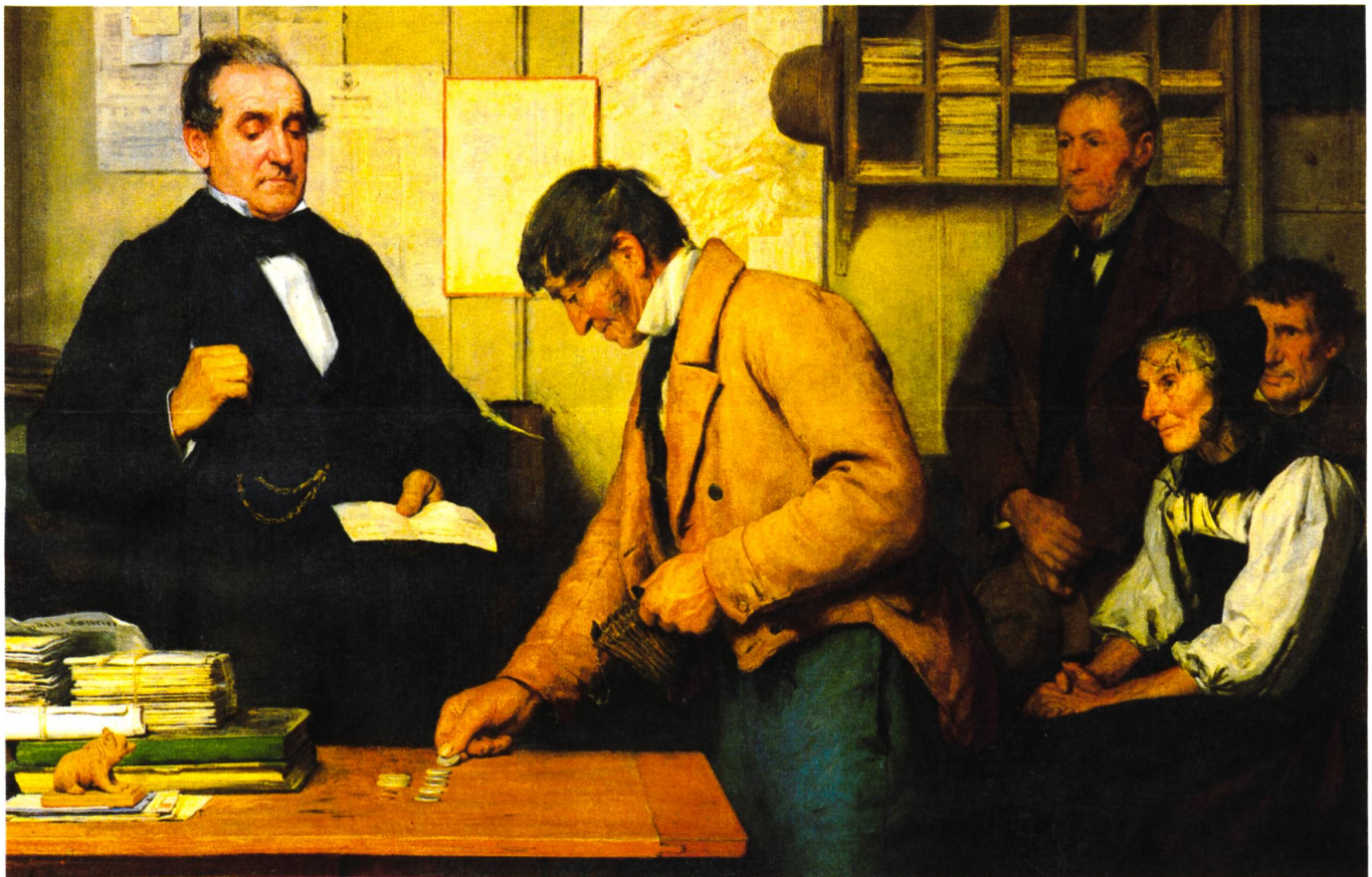
Albert Anker, der Zinstag , 1871.