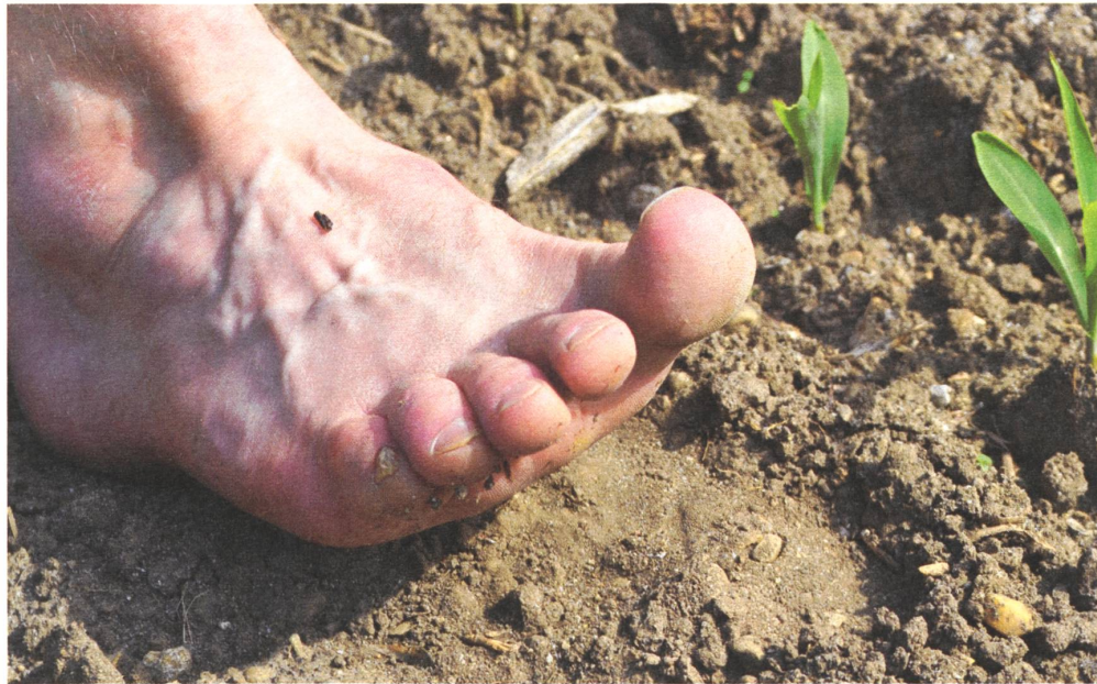
Der ökologische Fussabdruck...