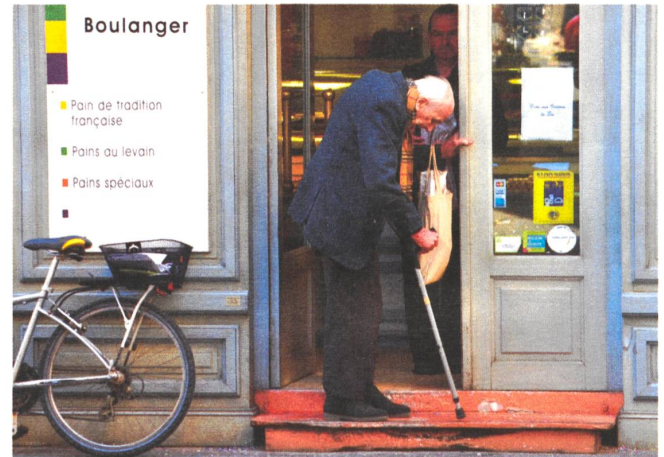
Was nützen ihm Supermarkt und Vertragslandwirtschaft?

Landwirtschaft und Versorgung kümmern wollen. Das fördert gegenseitiges Verständnis. Einerseits. Aber erneut entwickelt sich ein unvollständiges Leitbild der Versorgung, das nur Leitbild sein kann, weil es nicht die ganze Realität ins Auge fasst: Kein Konsument, keine Konsumentin kann nur mit dem in Direktvermarktung oder Direktbeschaffung verfügbaren Warenkorb auskommen. Es braucht «den Laden» weiterhin – im Bewusstsein und im Leitbild bleibt er aber verdrängt.