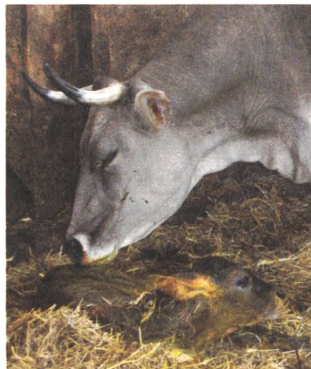
Neugeborenes mit seiner Mutter.