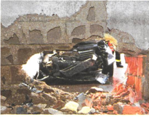
Er hatte die Klappe in der Wand nicht bemerkt.

Gesellschaft, das menschliche Zusammenleben. Und für Beuys war eindeutig nur direkte Demokratie die politische Struktur, die eine solche Verwirklichung ermöglichen kann. Folge seines Wirkens sind unter anderem «Büro und Omnibus für direkte Demokratie in Deutschland» (heute noch aktiv!), wo ziemlich sicher viel vehementer und differenzierter über direkte Demokratie nachgedacht wird als von uns Schweizern. Wichtig scheint mir auch, dass für Beuys das «Kapital» die menschliche Kreativität, Fantasie und Lebenskraft war; er meinte damit nicht der Realwirtschaft entzogene und hochkantig gestapelte Geldwerte. Als Pädagoge sprach er also indirekt von den Kindern (in den Menschen), wenn er «Kapital» sagte.