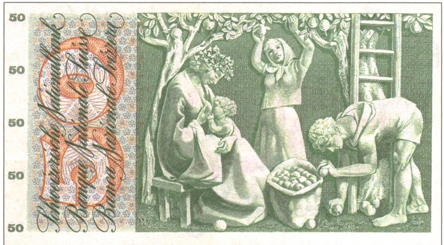
Wirtschaften als Wiederherstellung der Lebenskräfte: «Apfelernte» von Pierre Gauchat auf der Rückseite der 50-Schweizerfrankennote aus den 1950er Jahren.

Mein Selbstversorgungsansatz zielt nun darauf ab, vor allem die drei unteren Schichten dieses Kuchens ins Auge zu fassen, zu pflegen und dort nach Lösungen zu suchen. Die Geldwirtschaft betrachte ich nur als zusätzliche Möglichkeit. Primär geht es mir auch darum, die Lebenskräfte und -quellen so zu nutzen, dass sie sich wiederherstellen. Der Zweck des Wirtschaftens, so wie ich es verstehe, ist die Wiederherstellung. Der Zweck des Essens besteht – abgesehen von der Freude, die es mir bereitet – darin, sicherzustellen, dass meine Kraft sich erneuern kann. Der ökonomische Prozess ist also ein Wiederherstellungsprozess. Wir erwirtschaften auf Basis der Natur und der Agrikultur – dem Erbe der Vorfahren – und durch unser gärtnerisches Tun z. B. Äpfel und Gemüse. Diese heranwachsenden Lebensmittel bereiten wir selber als Nahrung zu und essen sie. Dieses Essen wiederum leistet einen wesentlichen Beitrag dazu, dass unser Leben erhalten bleibt und unsere Kraft wiederhergestellt wird. Die Natur, bzw. was wir gemeinhin als Natur bezeichnen, zeigt an vielen Beispielen, dass sie durchaus imstande ist, diesen «Lebensprozess-Wirtschaftspro-